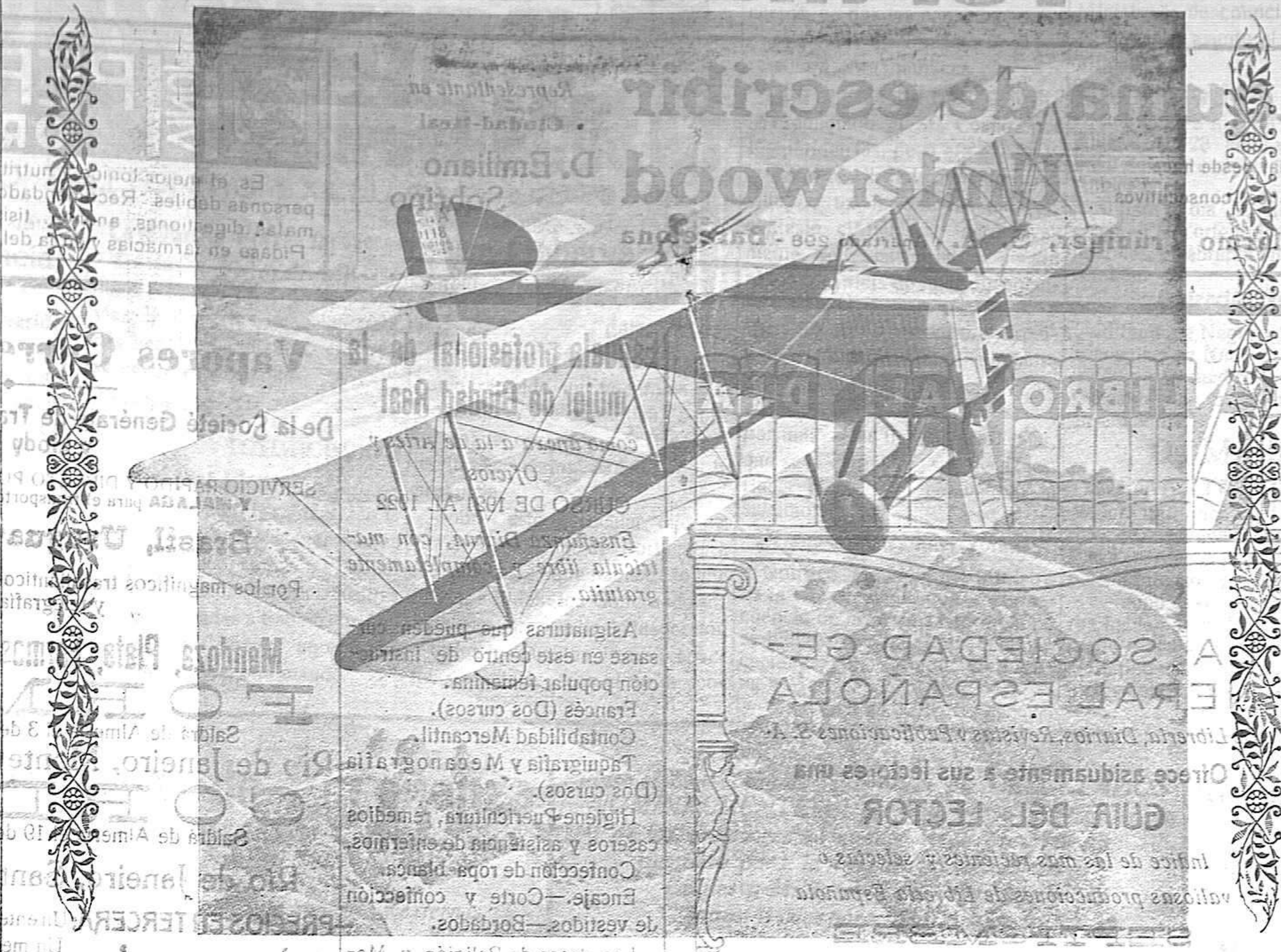
Avión «Bréguet» tipo XIV A2, que importa 32.000 pesetas, adoptado por la Aeronáutica militar española.

Todos cuantos conocen la región del Rif y se han ocupado de sus orígenes, usos y costumbres de sus moradores, coinciden en afirmar que es notable la diversidad de razas entre los kabileños de la provincia de Guelaya, en las proximidades que pueblan el resto de aquel territorio. Fue Méjilla por espacio de siete siglos el paso obligado de los árabes que invadieron la Península y gran parte de ellos se establecieron en sus inmediaciones a raíz de la conquista de Granada, con propósito de pasar el estrecho al recibir refuerzos. También se quedaron en Mazuz y Frajana las familias moriscas, expulsadas en el reinado de Felipe III, y los desertores y penados fugados, cuyo número se calcula en treinta mil, han tenido predilección por establecerse allí, contrayendo matrimonio de las kábilas vecinas y conservando todavía sus apellidos españoles. Aunque tan heterogéneos elementos sean suficientes a explicar que en Guelaya no predomine el tipo marcadamente rifeño, ni tampoco el característico de los árabes, los habitantes de aquella provincia atribuyen tal diversidad de razas a un suceso cuya tradición conservan y relatan con el nombre de La Leyenda del Garrón (niño). He aquí un extracto tomado en el país de viva voz y que citan también algunos historiadores especialmente nuestro amigo D. Rafael Fernández de Castro, al ocuparse en describir los territorios