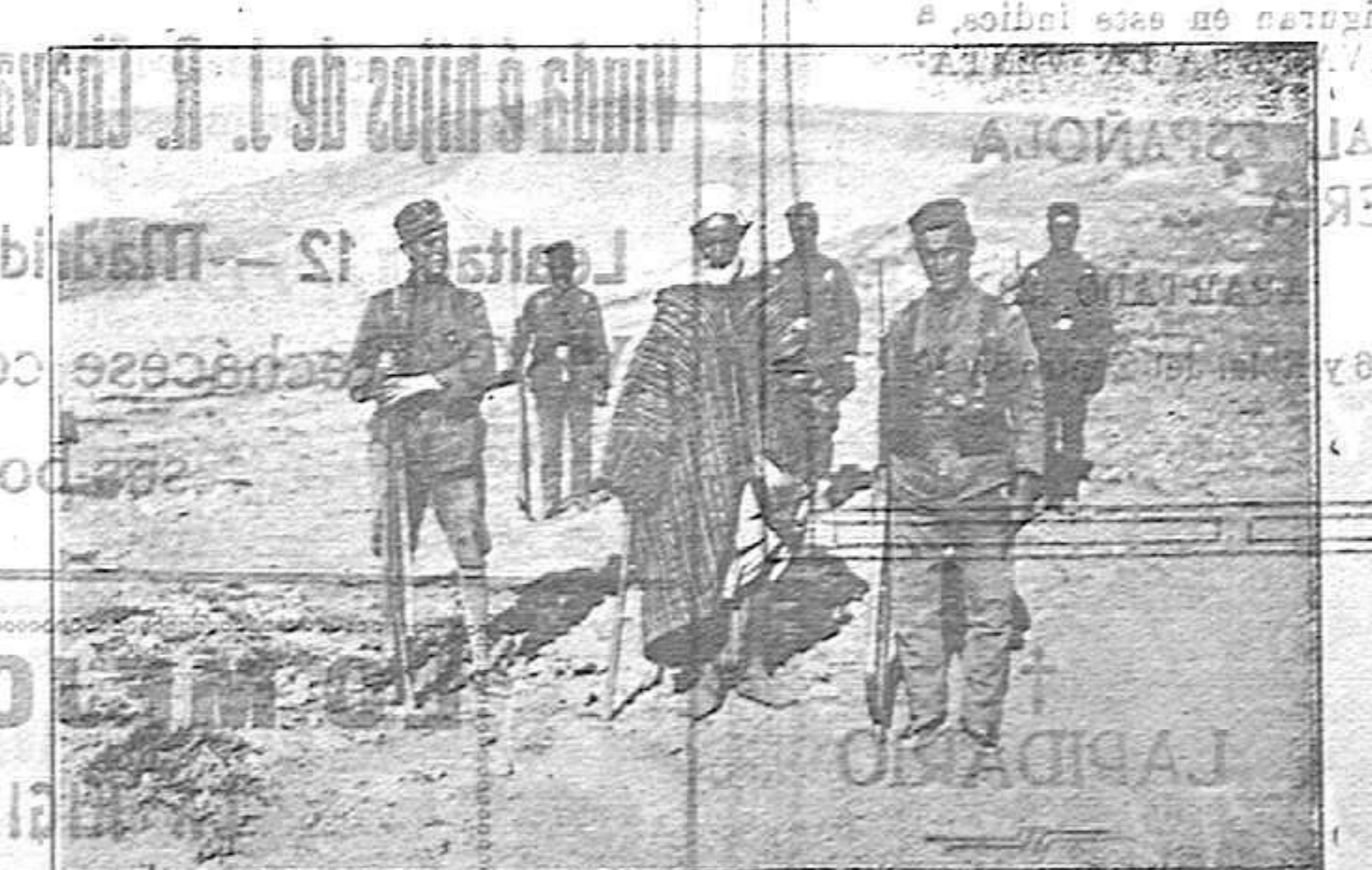
Méjilla.—Ocupación de posiciones en Benisicar. Conducción de un santon cogido con armas en la mano.