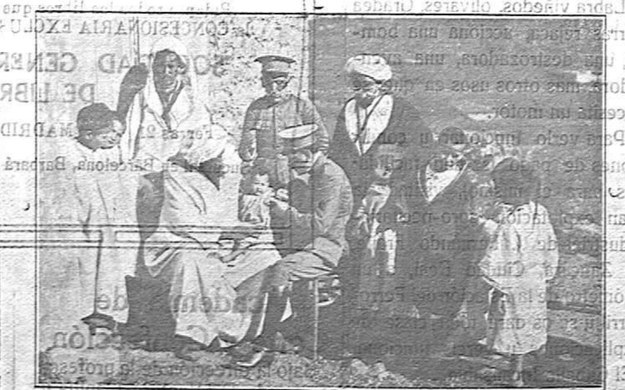
Méjilla.—La ingratitud del moro. Los médicos recorrian las kábilas vacunando a los niños para evitar los estragos de la viruela.