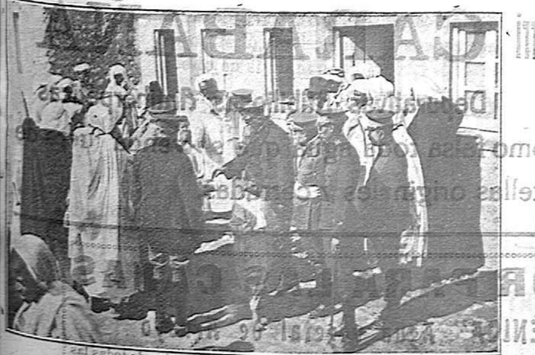
Méjilla.—La ingratitud del moro. Oficina indígena. Reparto de premios a los niños rifeños en las escuelas creadas por la Oficina indígena.