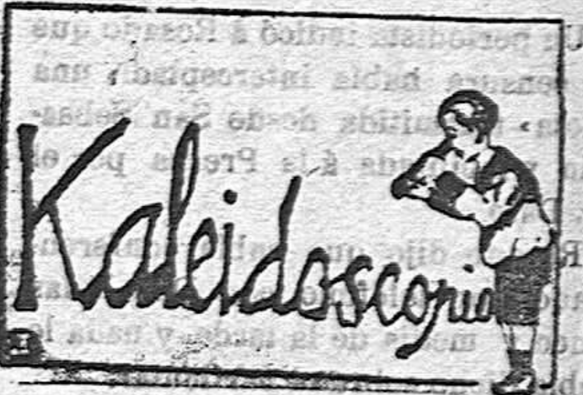
Dicha que no tuvo Carmen

«Los Alcaldes que no hayan remitido ya el ejemplar de las declaraciones presentadas ó no las envíen á este Gobierno, el día 31 del actual, como plazo improrrogable, que han incurrido en responsabilidad y multados con 500 pesetas por su negligencia.» «Con arreglo á las citadas declaraciones presentadas en esa alcaldía, procederá el señor secretario del Ayuntamiento á formar un estado resumen del total recolectado de dichas especies, expresándolo en quintales métricos, y remitiendo dicho resumen á este Gobierno en la misma fecha 31 del actual.»