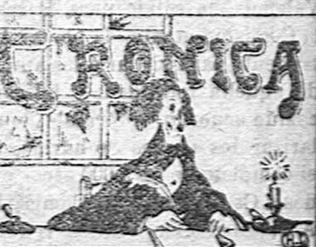
Beethoven se enfada

Compre V. diariamente EL PUEBLO MANOHEGO.