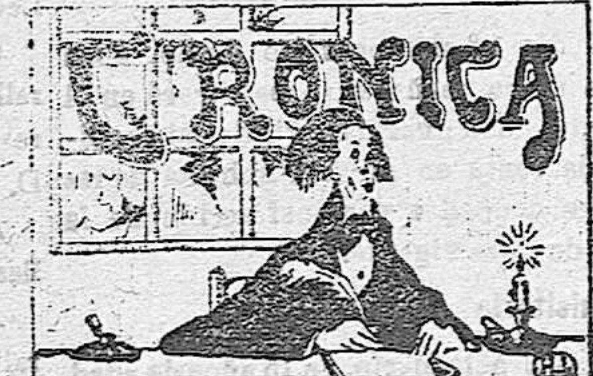
La vida anecdótica