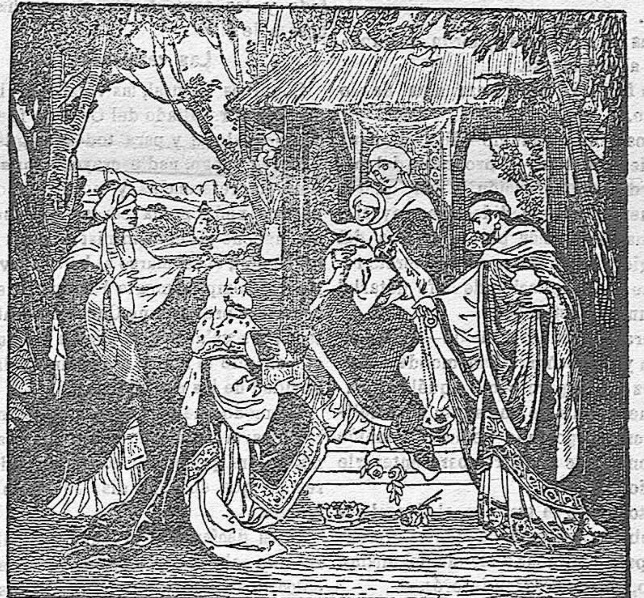
La adoración de los Reyes Magos