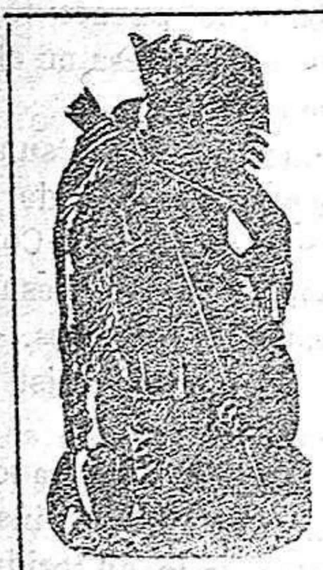
Aceite de SEQUAH MARCA REGISTRADA