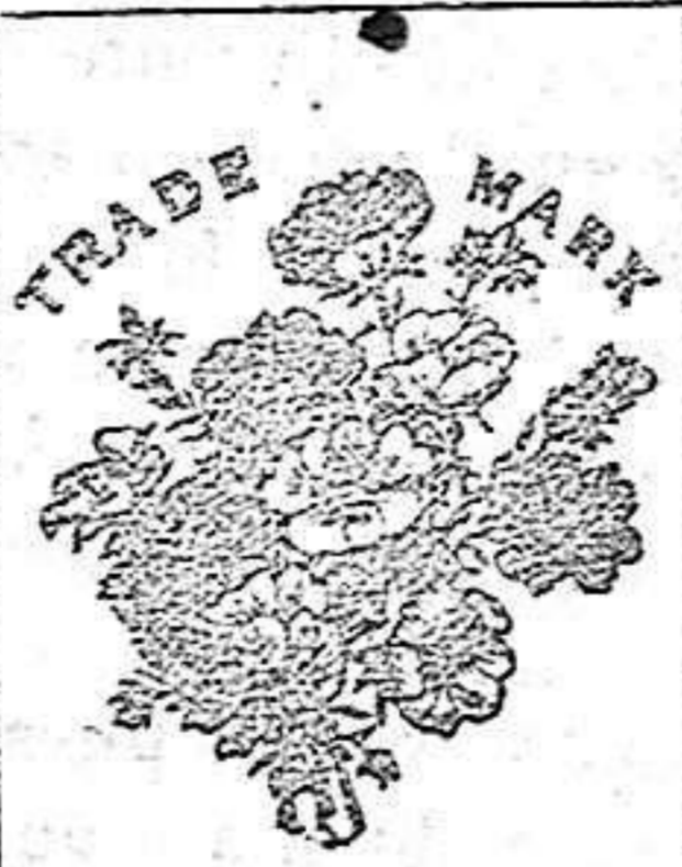
Flora de la Sabana de SEQUAH

No contienen ninguna substancia nociva. Los muchos millares de certificados de personas que deben la curación de sus enfermedades á estos dos prepara- dos y los brillantes elogios de varias corporaciones científicas del mundo entero, son el mejor elogio que pueda descarse.