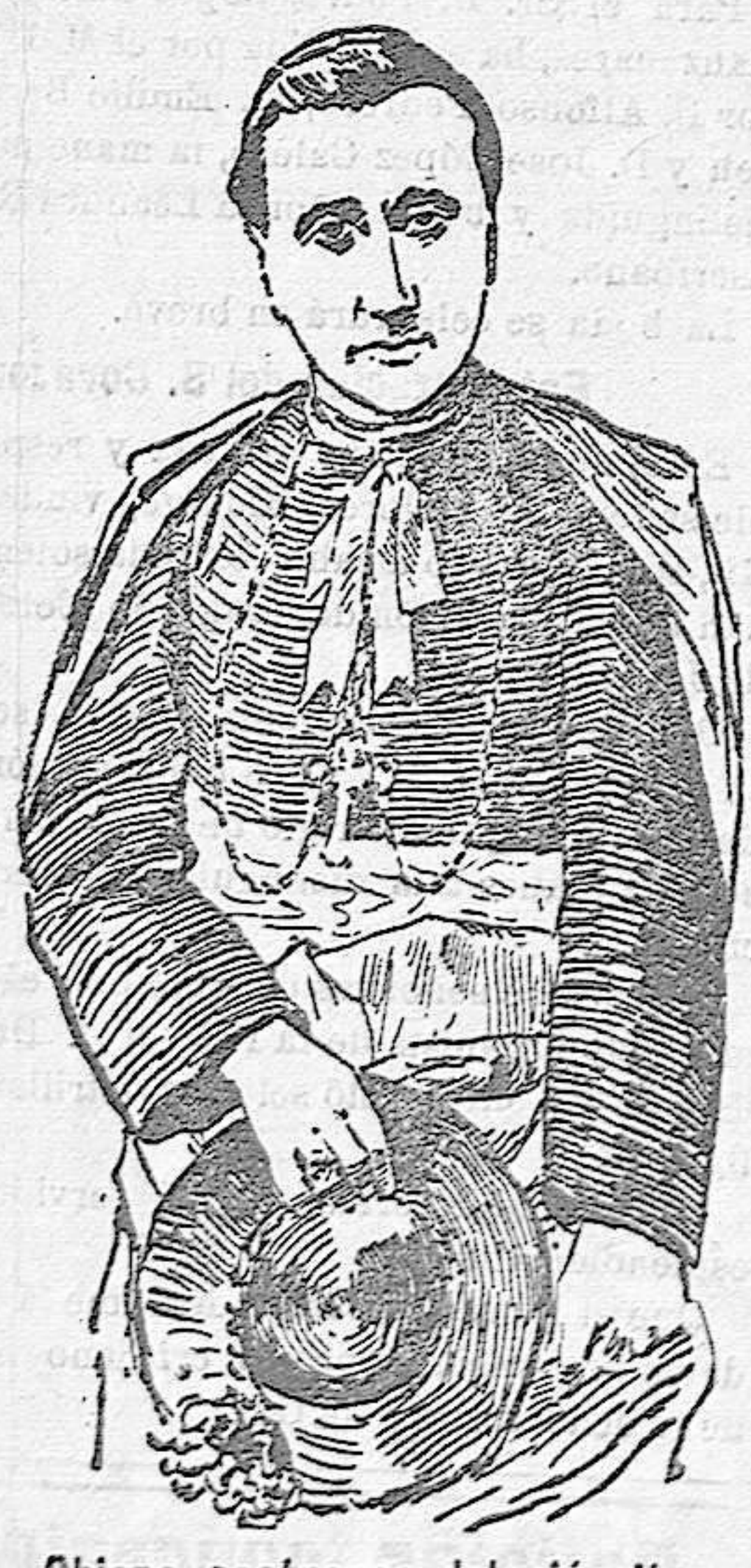
Obispo castrense del ejército italiano

En el momento de llegar la procesión á la Plaza de la Constitución, ésta presentaba un imponente aspecto por los miles de almas, que allí había, reinando