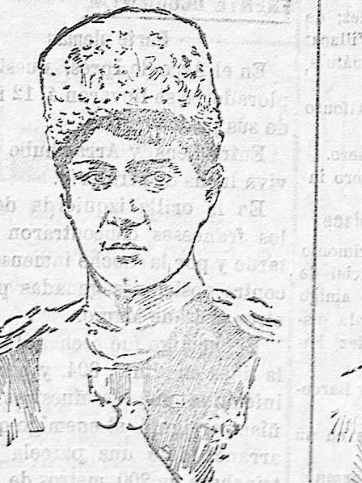
El príncipe Alesén Nicoláiewitch hijo de Nicolás II, de Rusia

La regencia del Imperio ha sido recomendada por el Comité revolucionario al hermano del Emperador, el gran duque Alejandrowitch, que cuenta 38 años