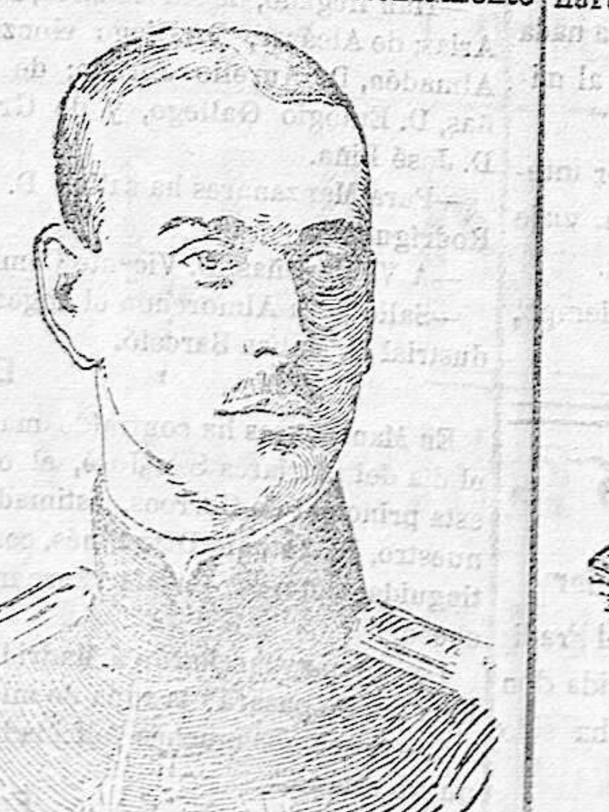
El gran duque Miguel Alejandrowitch, en quien ha abdicado la corona de Rusia el Czar Nicolás II, su hermano con el Gobierno...