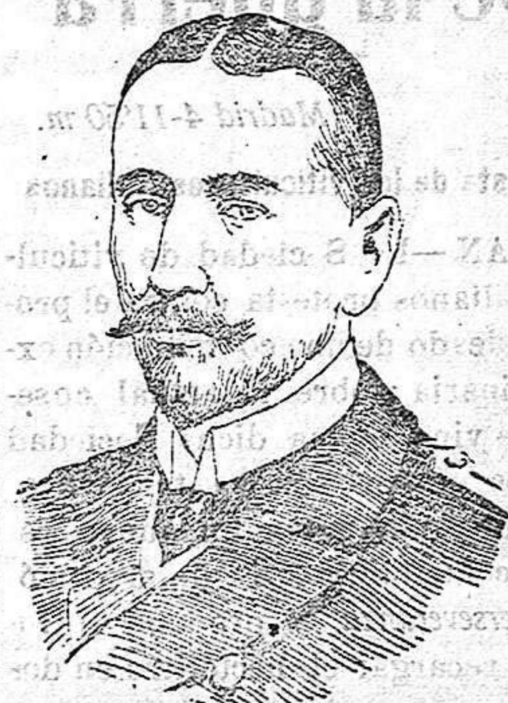
Almirante von Capelle, nuevo ministro de Marina alemán.

del Excmo. Sr. Nuncio y en nombre de las publicaciones católicas españolas. La misma distribución se hará probablemente en todas las Diócesis de España, habiendo, por lo menos y hasta el presente, noticia de que han tomado el mismo acuerdo los Eminentísimos señores Cardenales de Toledo y Valladolid, los Excmos. Sres. Arzobispos de Granada y Tarragona y los Rvmos. Prelados de Almería, Calahorra, Cádiz, Cartagena, Ciudad Rodrigo, Córdoba, Cuenca, Jaén, León, Lérida; Mallorca, Mondoñedo, Orense, Osma, Palencia, Plasencia, Salamanca, Segorbe, Seo de Urgel, Solsona, Tarazona, Tenerife, Teruel, Tuy y Zamora, todos los cuales, reservándose el 65 por 100 (60 por 100 para las prensas diocesanas y 5 por 100 como fondo de reserva) en sus respectivas diócesis, enviarán el 35 por 100 restante á la Junta Central de Sevilla para que, unido al 35 por 100 de la colecta de Sevilla, sea distribuido por la misma Junta Central en la forma acordada, entre el Dinero de San Pedro el Tesoro Nacional y el fondo de reserva para promover la Fiesta el año próximo. Por nuestra parte aplaudimos sin reserva esta distribución y expresamos nuestra gratitud á los Rvmos. Prelados.