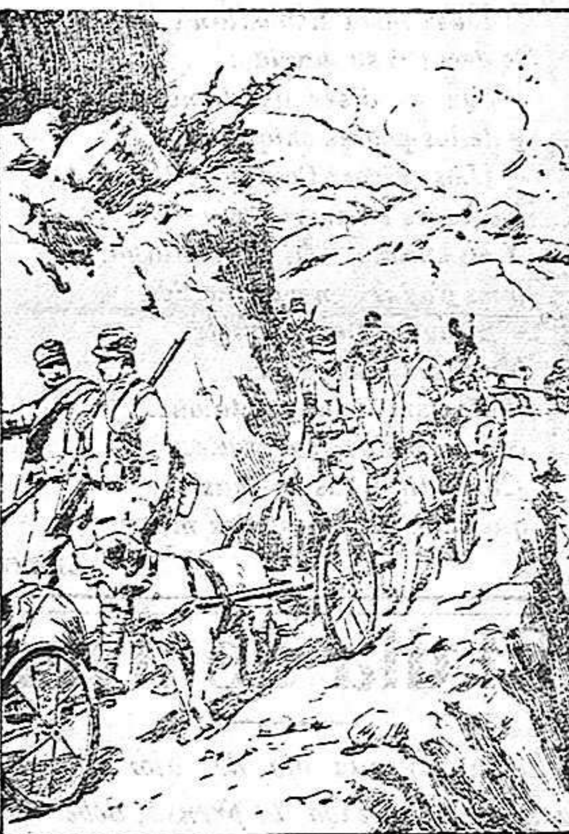
Columna austriaca de aprovisionamiento, conduciendo agua a las posiciones avanzadas del Trentino.