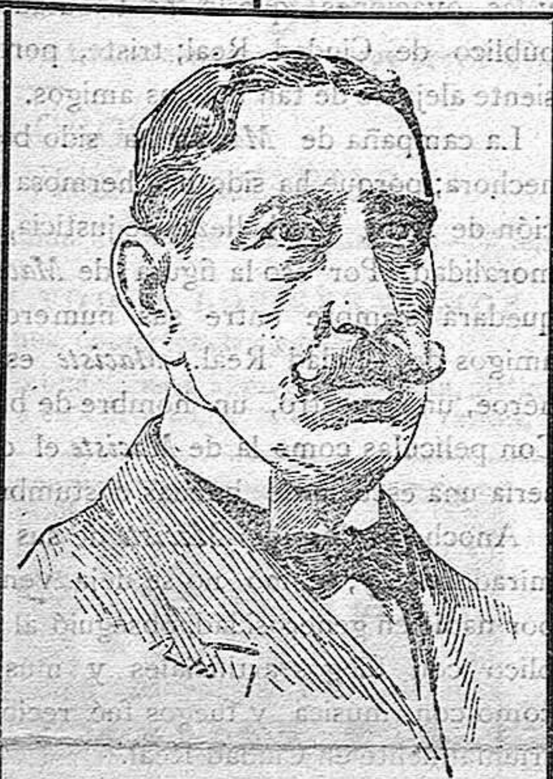
DON RAFAEL GASSET, nuevo ministro de Fomento