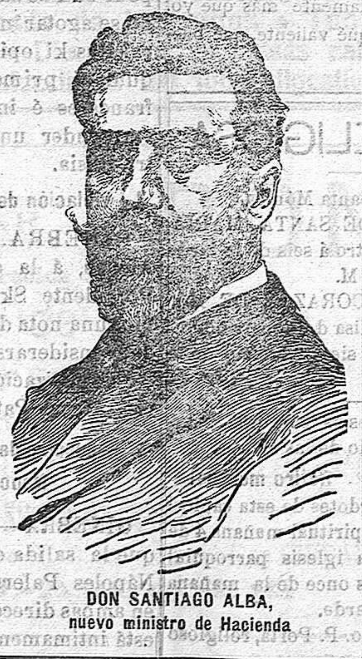
DON SANTIAGO ALBA, nuevo ministro de Hacienda