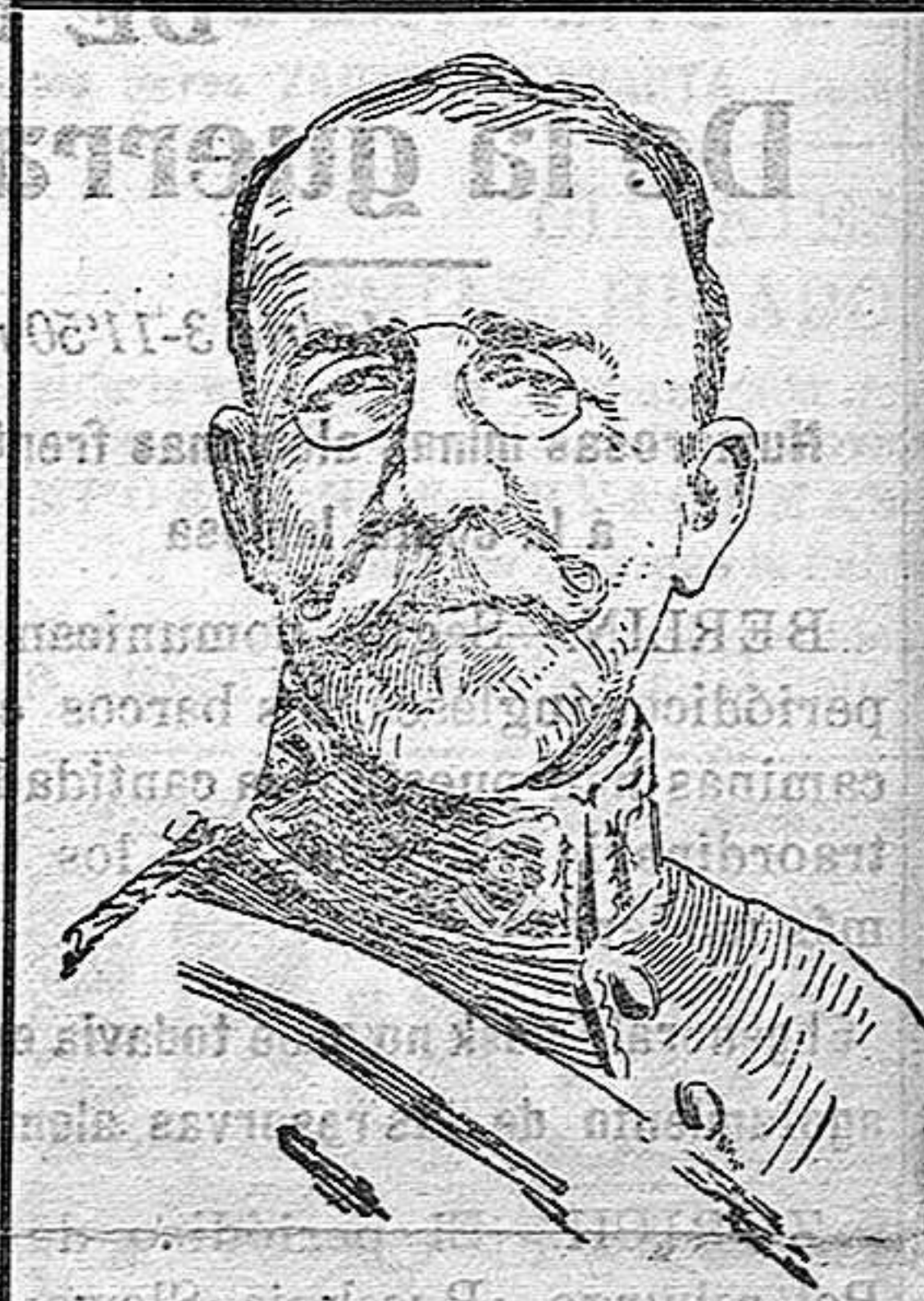
DON JOAQUIN RUIZ JIMENEZ, nuevo ministro de Gobernación