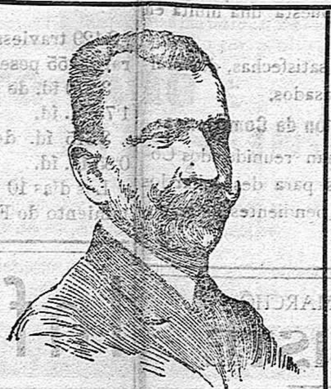
DON AMALIO JIMENO, nuevo ministro de Estado