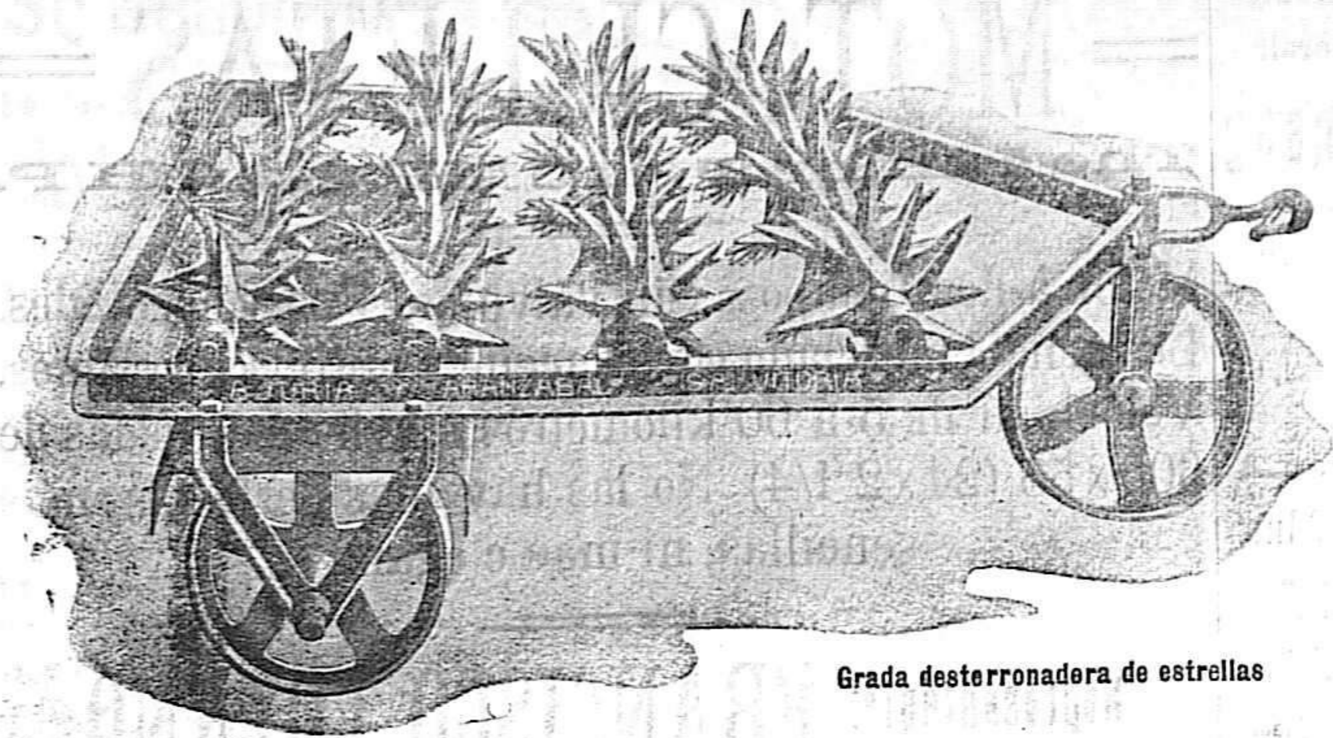
Grada desterronadora de estrellas