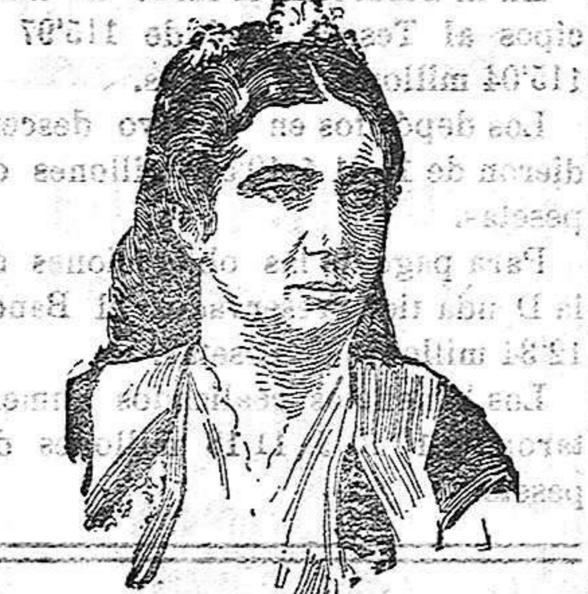
La reina Myleu de Montenegro, que con sus hijos ha abandonado su país instalándose en Lyon.