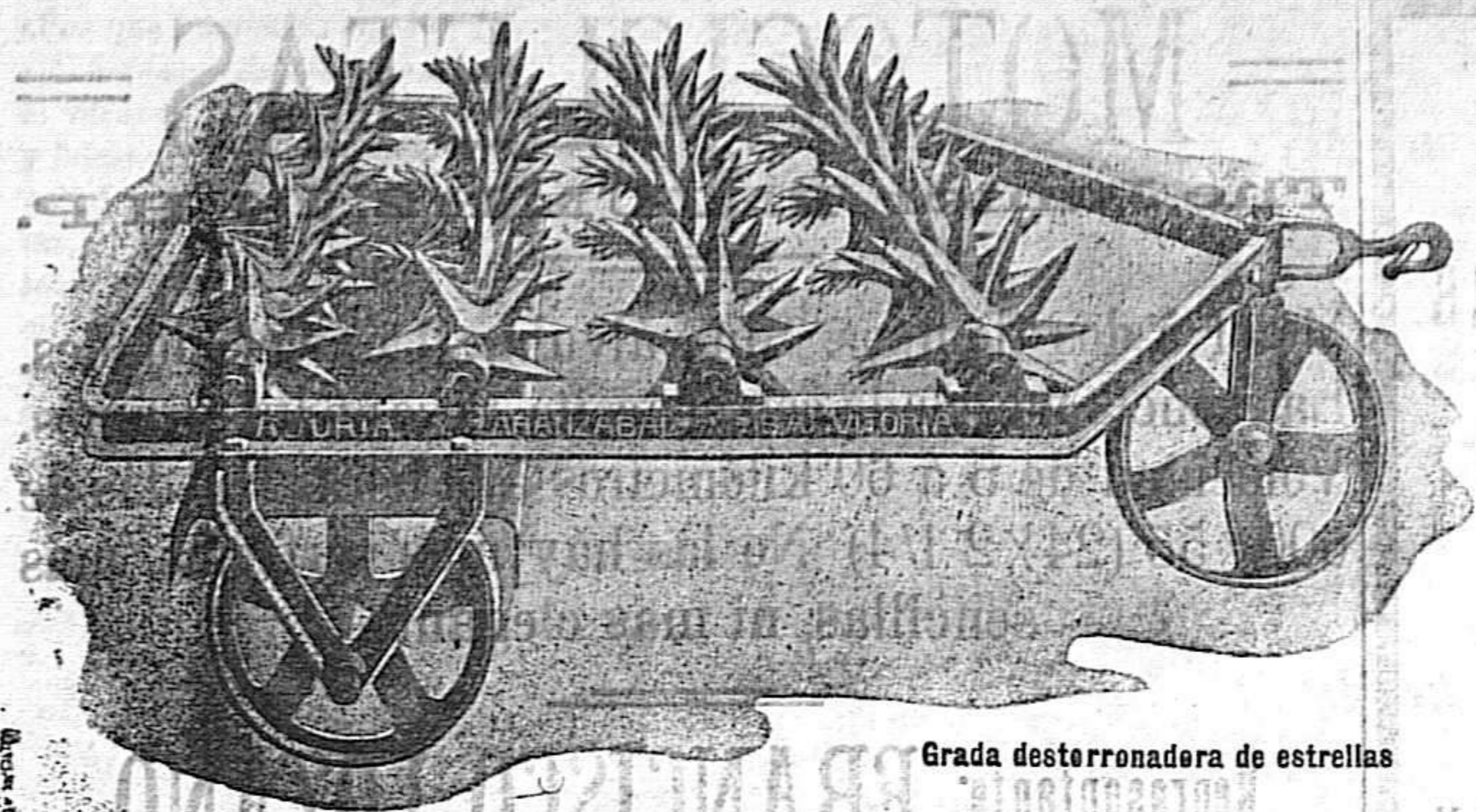
Grada desterronadora de estrellas