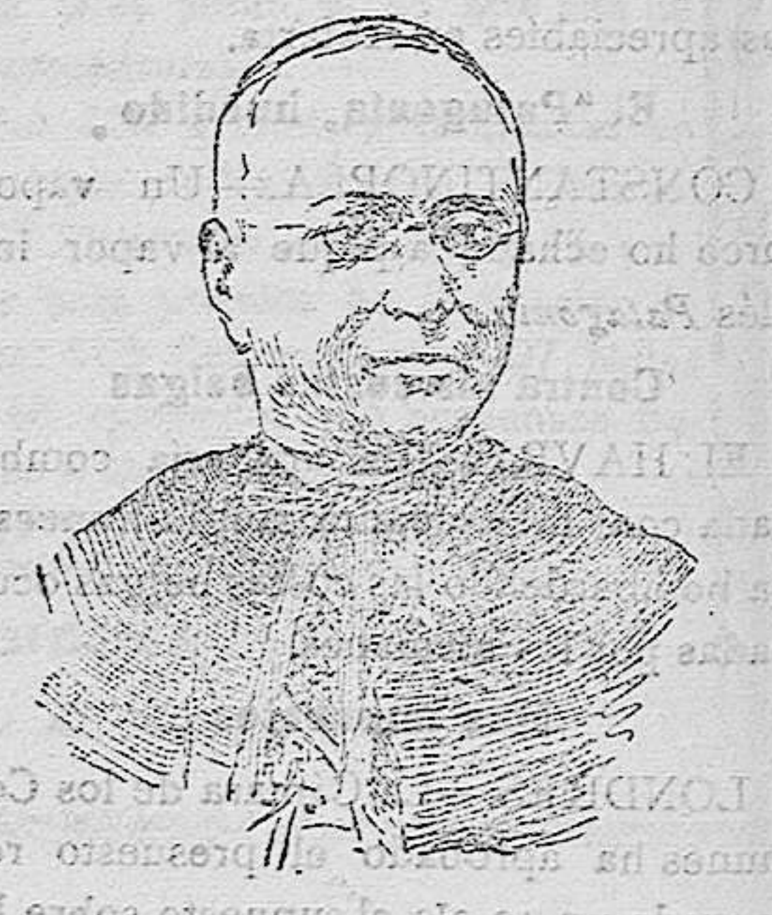
EL CARDENAL BENEDICTO LORENZELLI, MUERTO EN ROMA.