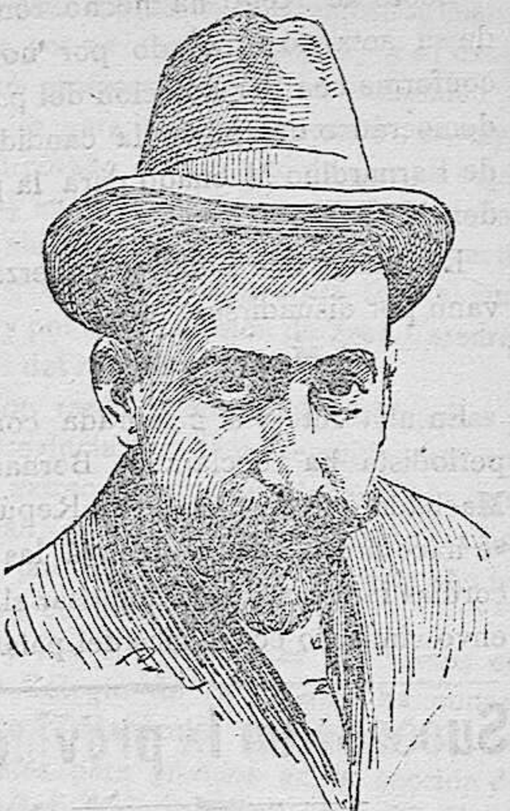
Don Jacinto Benavente

Consideradas las mencionadas obligaciones con el carácter de efectos públicos, según el expresado decreto, y habiéndose entregado al Banco de España representadas por carpeas provisionales una por cada título con la misma numeración de ellos, en canje de otras de la serie B, que ingresan en la Caja de la Tesorería Central, podrán salir a la contratación pública en cuanto el ministerio de Fomento se sirva dar la autorización a que se refiere el artículo 17 del reglamento de la Bolsa de Madrid.