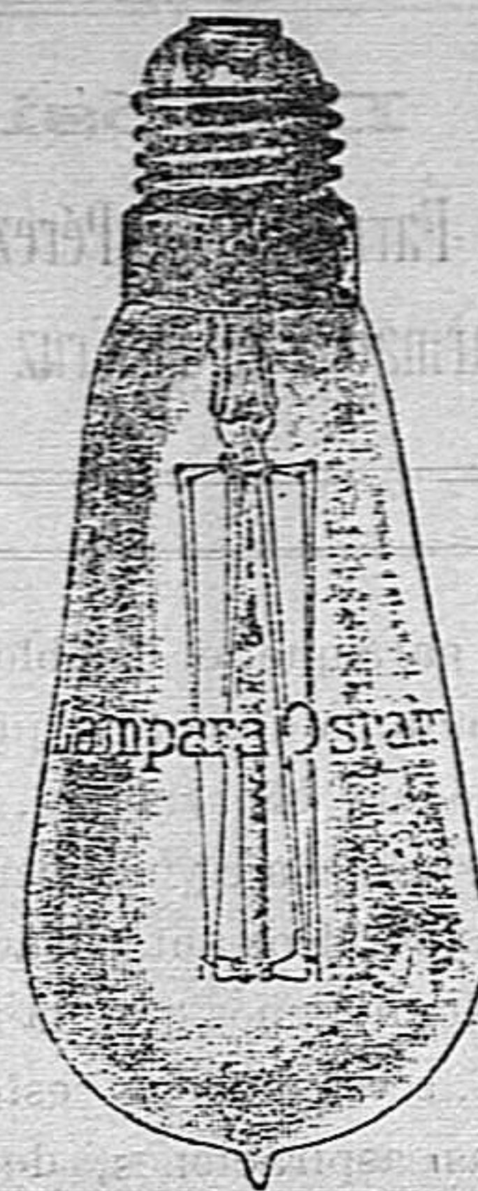
Exijase la marca OSRAM grabada en el cristal