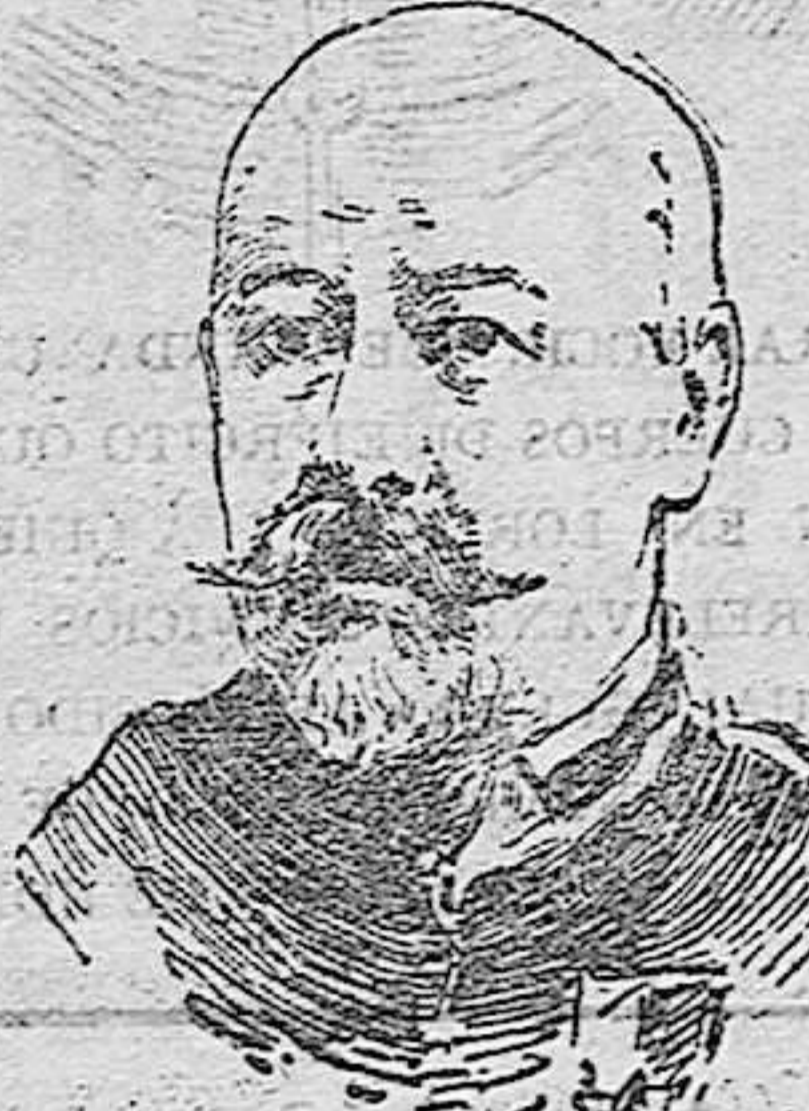
GENERAL SOUKOMINOFF, MINISTRO DE LA GUERRA DE RUSIA.

Y de este criterio participa con su nación, el rey.