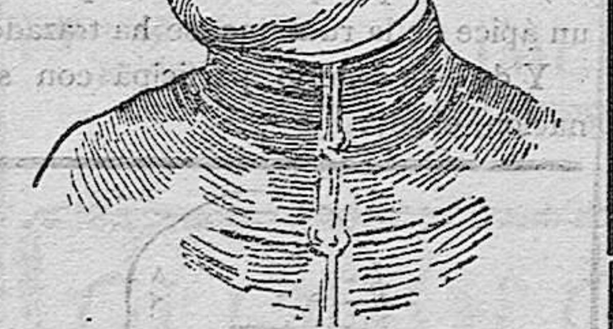
GENERAL FOCH, QUE MANDA UNO DE LOS CUERPOS DE EJERCITO QUE OPERAN EN LORENA, Y A QUIEN POR SUS RELEVANTES SERVICIOS EN LA ACTUAL GUERRA LE HA SIDO OTORGADO EL NOMBRAMIENTO DE GRAN OFICIAL DE LA LEGIÓN DE HONOR.