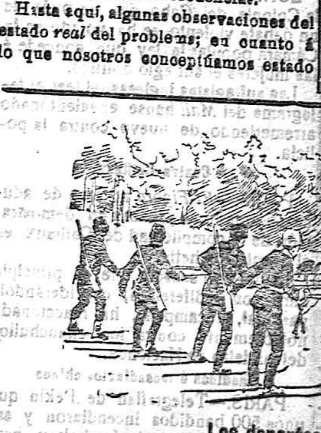
Los deportes en Rusia