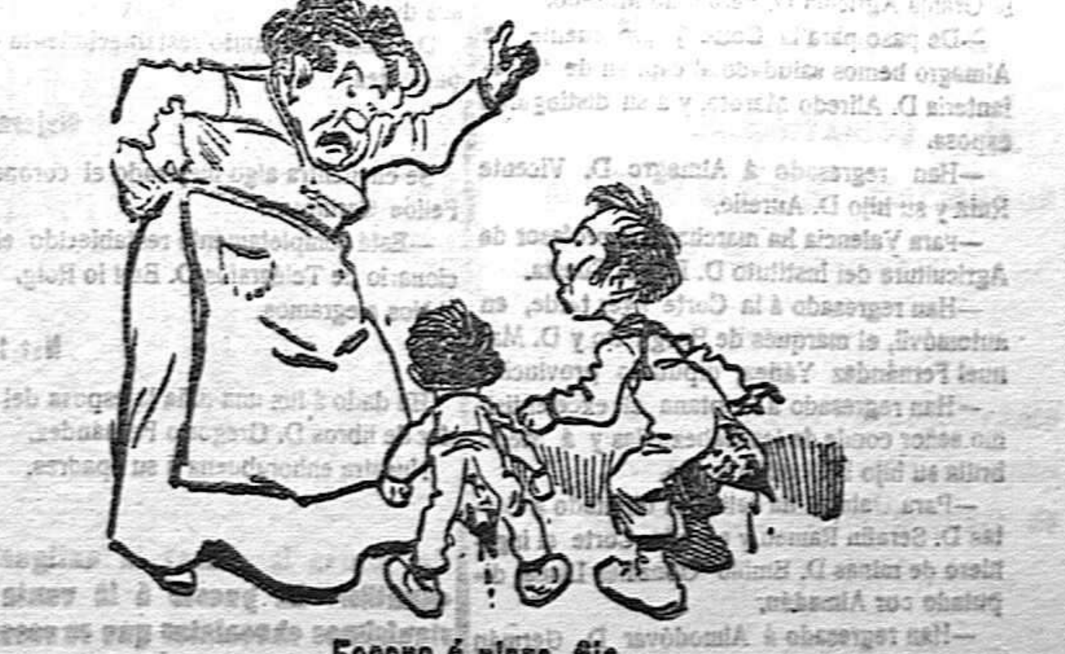
Escena á plazo fijo