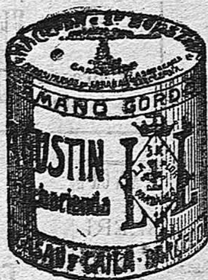
Garbanzo Sauce (5 Kilos)