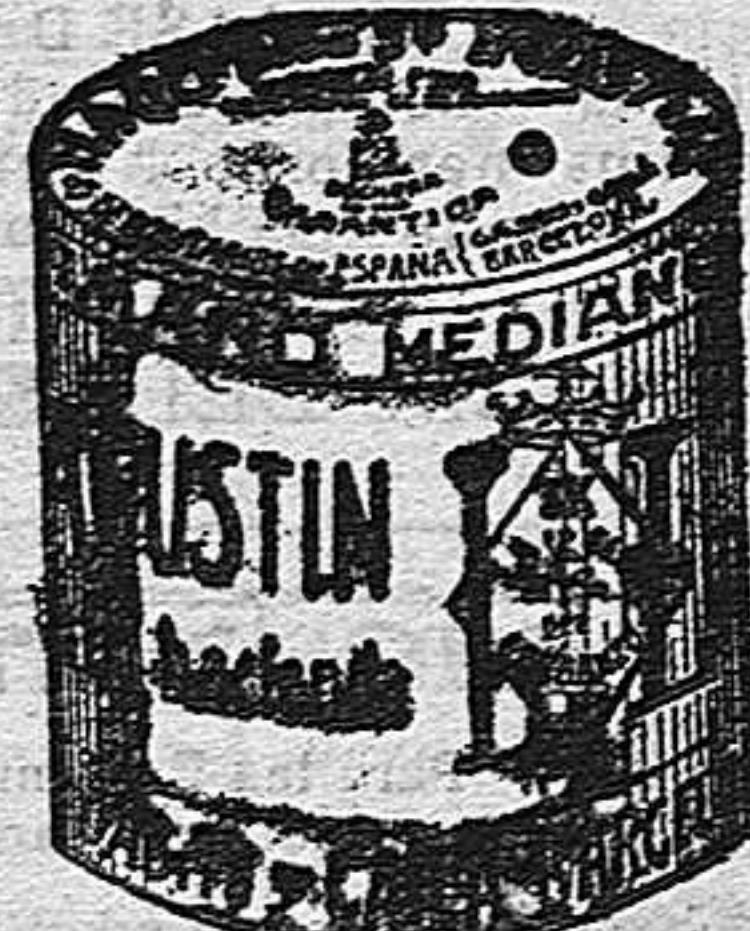
Garbanzo Sauce (5 Kilos)

Garantizamos al público que los comestibles empaquetados con nuestra marca son naturales de la planta, y sin contener la más pequeña adulteración en beneficio de ellos ni para hermosarlos, por lo cual nos hacemos responsables á todo análisis que quiera efectuarse.