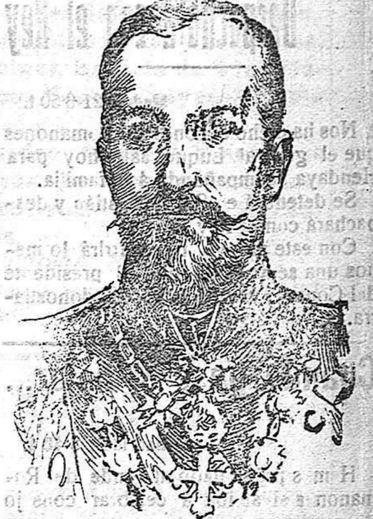
El Zar Fernando de Bulgaria

Y oán amargos deben ser los actuales momentos para Fernando de S. Jonia Coburgo Goth! Soñó verse proclamado emperador de los Balcanes, y en cuanto intentó convertir su sueño en realidad, ha visto venidas sus tropas cuantas veces empuñaron combate con los que él tenía por sus futuros súbditos, y para colmo de desdichas, se ve obligado