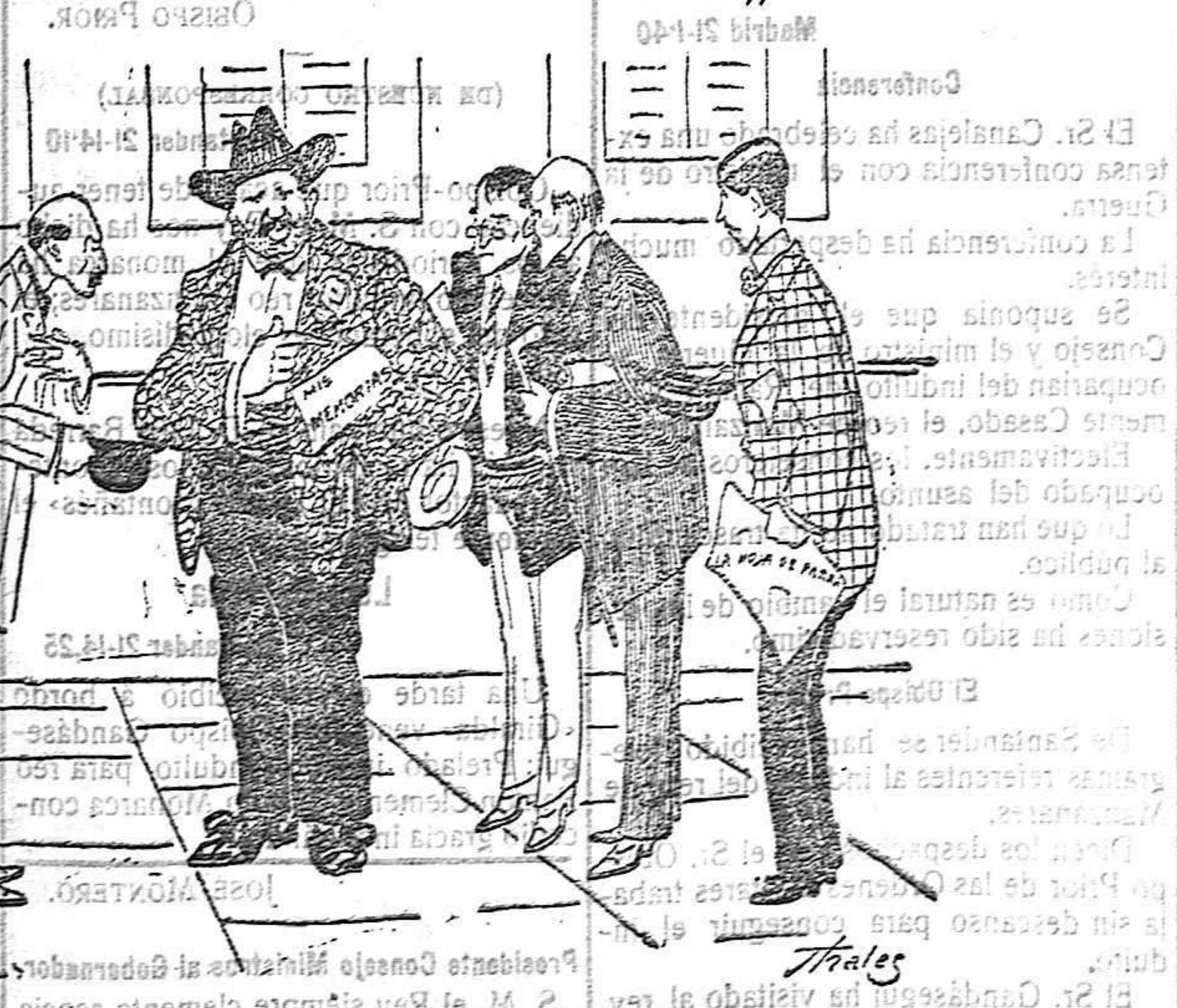
D. Joaquín. Nuestros periódicos esperan verse honrados con su firma. Ahora no pueo. Cuando acabe mis memorias hablaremos.