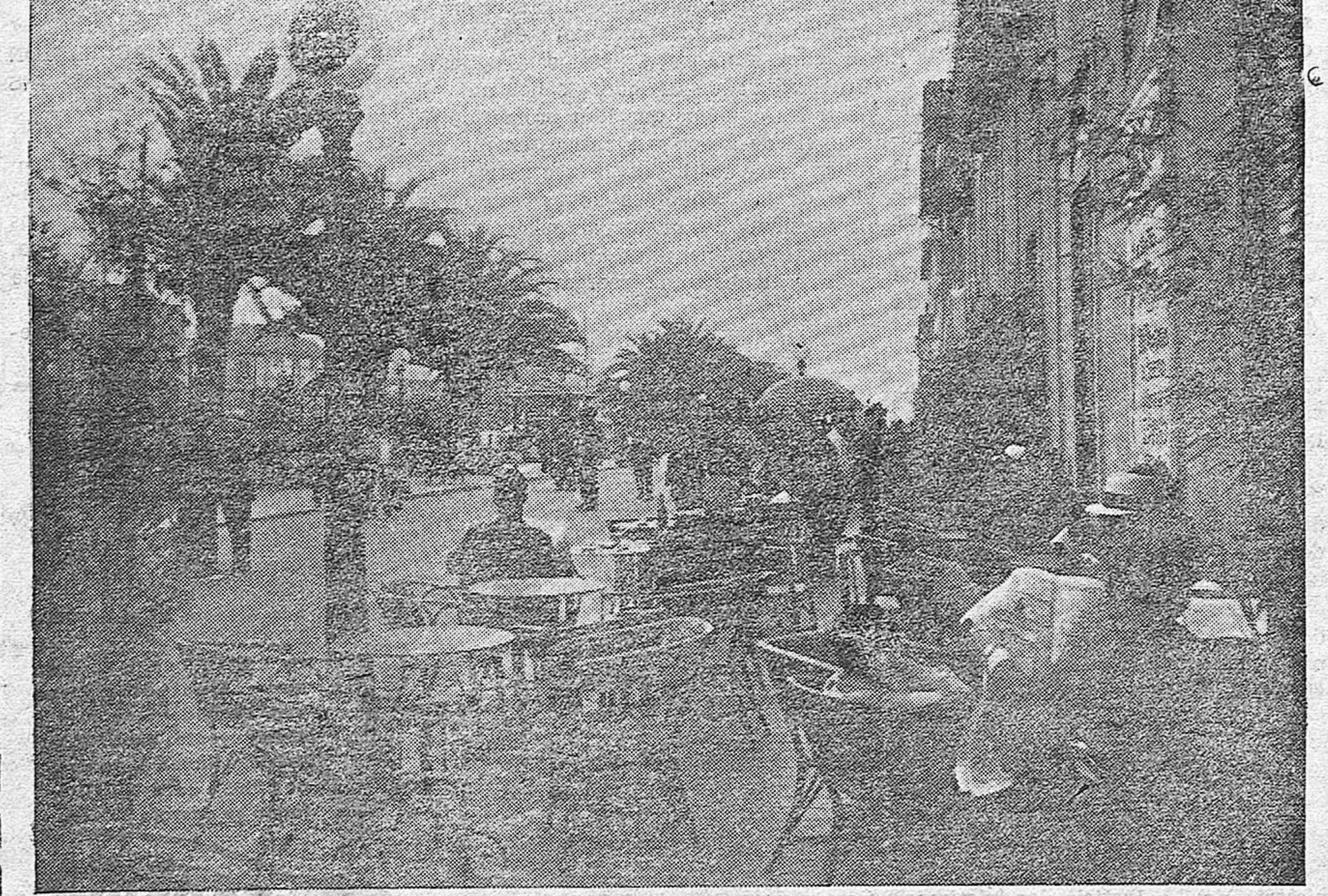
Vista de una de las calles de Espinho

teras realidades de las que participan ya las numerosísimas familias de esta provincia que se encuentran en Espinho y de las que se beneficiarán también las que en estos días de julio y primeros de agosto se disponen a disfrutar de las delicias que ofrece aquella incomparable playa. Espinho ya no es solamente el pueblo favorecido por la Naturaleza pródiga, cuyos habitantes dejan obrar por sí solo el milagro de la concurrencia de veraneantes que allí acuden sedientos de salud y ansiosos de bellezas, sino que colocándose a tono con el progreso moderno sale de sus moldes ancestrales y viene a las provincias españolas ofreciéndoles la máxima consideración de su hidalga hospitalidad aderezada con