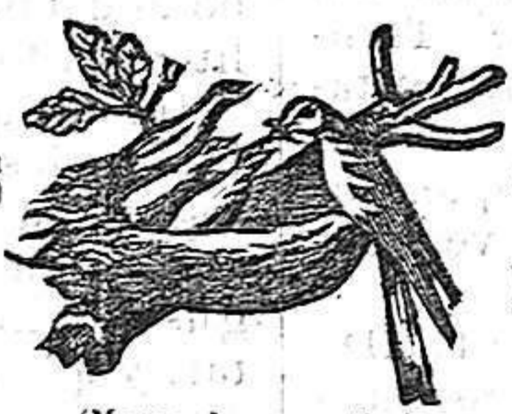
(Marca de garantía.)