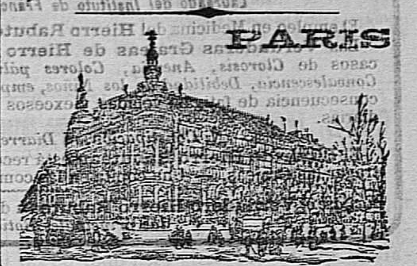
GRANDES ALMACENES DEL

Inocencio, que es el único remedio conocido para preservarse, y aun curarse de la terrible enfermedad la apoplejia, ó feridura. Frasco 20 reales.