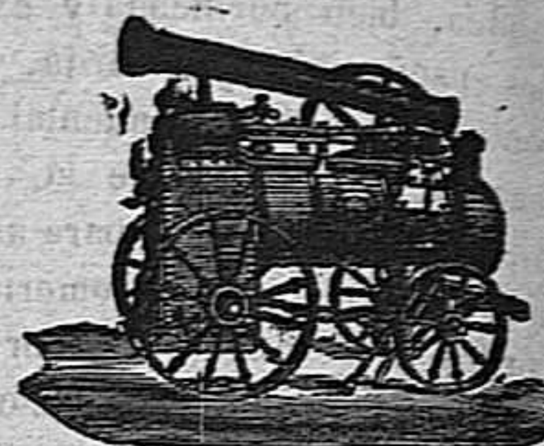
Máquina de vapor. Locomóvil.

Arados, Máquinas de vapor, y toda clase de maquinaria.