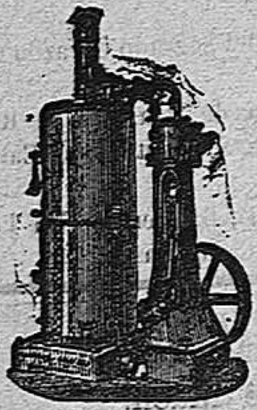
Máquina de vapor vertical.

SUCURSAL EN VALLADOLID: Acera de Recoletos, 6.