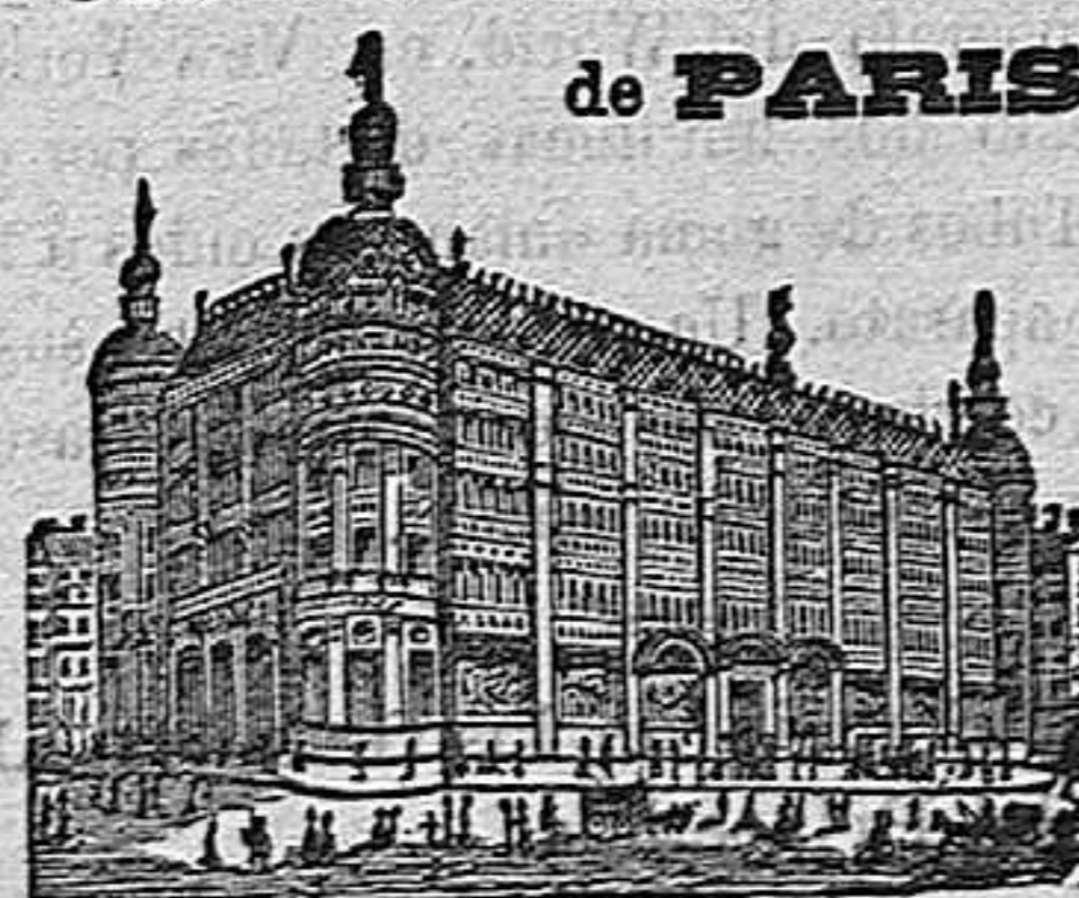
GRANDES ALMACENES DEL