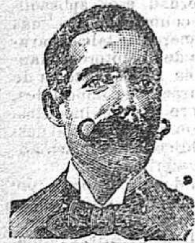
A. Salvat Costanza Diputación, 435, Barcelona

PROCURADOR.—San Francisco 22, 1.º 2.—TARRAGONA