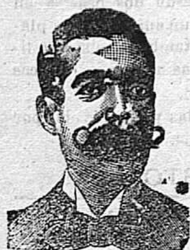
A. Sati Costanzi Diputación, 435, Barcelona