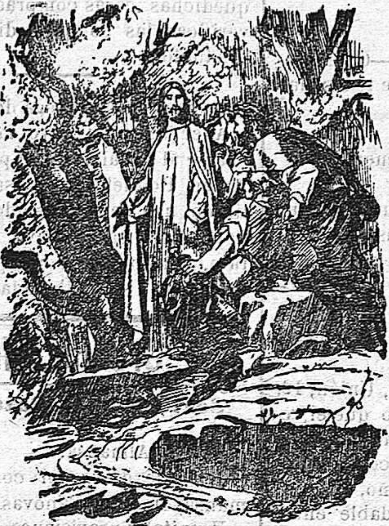
CRISTO EN EL HUERTO. (Cuadro de Jalabert)