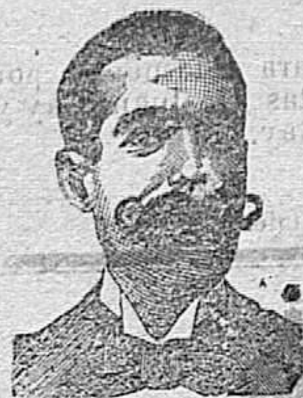
A. Salati Costanzi Diputación, 435, Barcelona