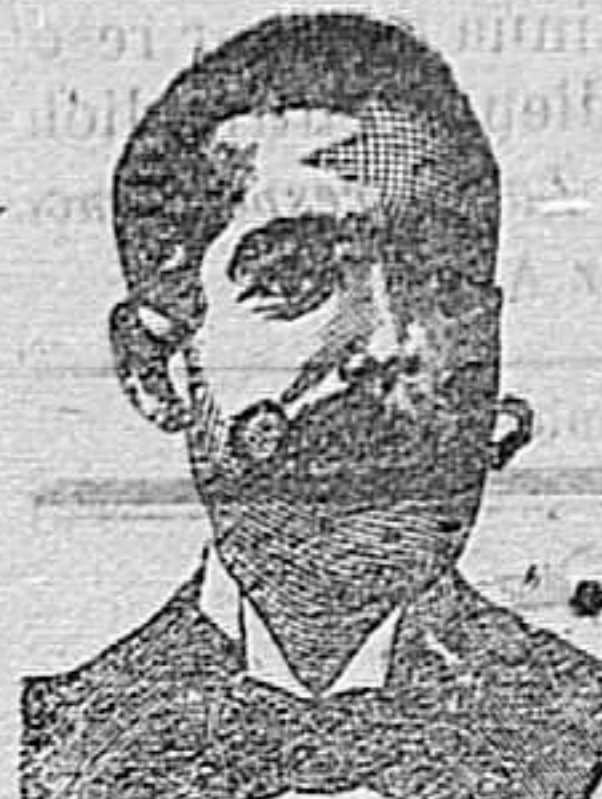
A. Salvati Costanzi Diputación, 435, Barcelona

Calle de la Unión, número 38.—TARRAGONA Variado y económico surtido de gorras y sombreros de todas clases 38, Unión, 38