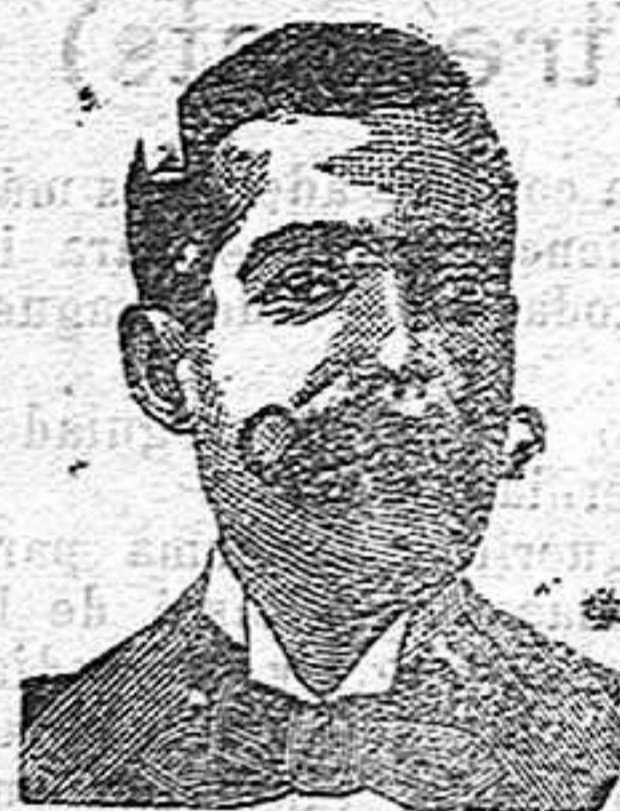
A. Salvati Costanzi Diputación, 435, Barcelona