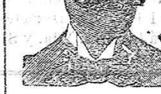
A. Salvati Costanzi Diputación, 435, Barcelona