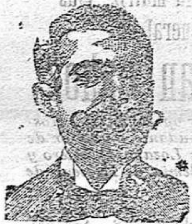
A. Salvati Costanzi Diputación, 435, Barcelona

Por esta cantidad, previamente depositada en el Banco de España, Casa de Banca ó Comercio de confianza para ambas partes, y a nombre de la persona interesada, se redime a metálico al mozo asegurado que le corresponda prestar servicio activo permanente.