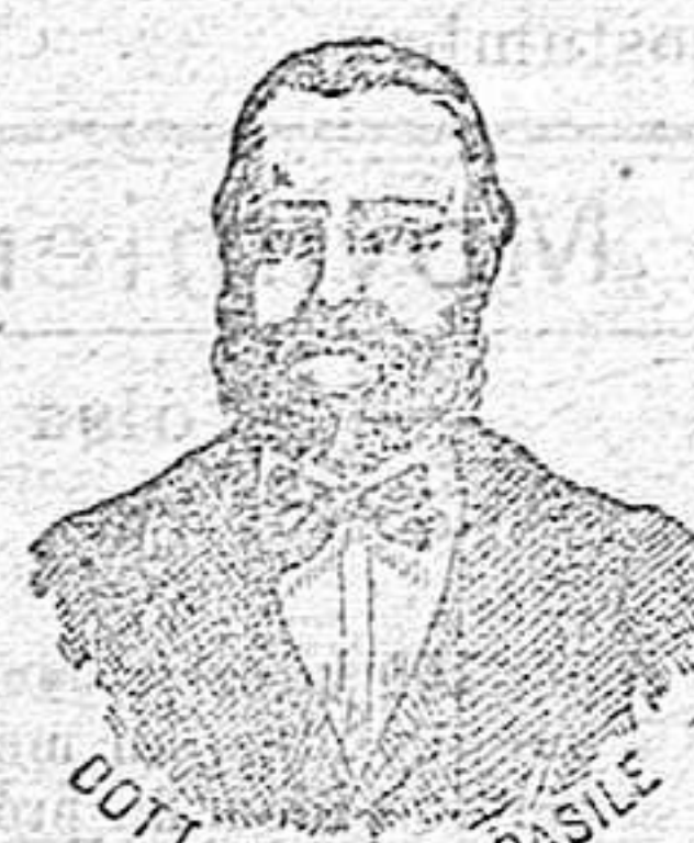
Diputación, 435 BARCELONA

han logrado que el Dr. Casile de Nápoles descubriera los milagrosos medicamentos que curan infaliblemente la tisis en cualquiera de sus períodos y todas las enfermedades del estómago. A la más pequeña manifestación de un resfriado, tos, catarro, bronquitis, gripe, asma (sofoación), expectoración y de cualquier enfermedad del pecho, tomar inmediatamente las PERLAS CASILE, que no sólo curan infaliblemente estas enfermedades, sino que se tendrá la completa seguridad de no contraer otras mucho más graves. Siguiendo este método se podrá decir no más tisis. Si por desgracia no se hubiera seguido este tratamiento y por desgracia cualquier persona se encontrara atacada de tisis, no tiene que apenarse porque gracias á constantes estudios hemos podido encontrar los renombrados CONFITES CASILE que asociados á las PERLAS combaten con eficacia la tisis en cualquiera de sus períodos.