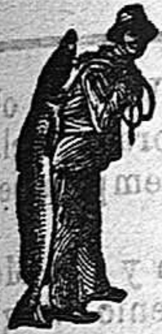
¡Obligase siempre la Emulsión El Pescador, marca del procedi- miento Scott!

¡Ninguna otra emulsión, más que la de SCOTT, podía haber salvado á este niño, porque ninguna otra emulsión se compone de los mismos materiales puros y enérgicos, ni gustan tanto al paladar del niño, ni se digieren con la misma facilidad por el estómago del nene. ¡Le conviene usar la emulsión que está probado que cura—la de SCOTT con