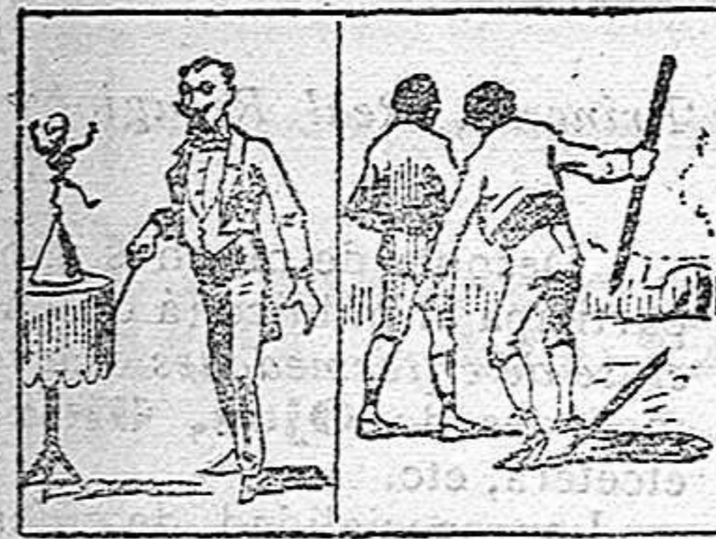
La solución en el próximo número.

Solución á la Charada en acción anterior. REMOLINO.