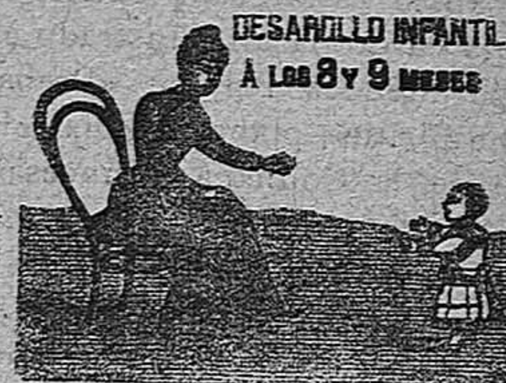
DESARROLLO INFANTIL A LOS 8 Y 9 MESES

Intérpretes á la llegada de los trenes y vapores.