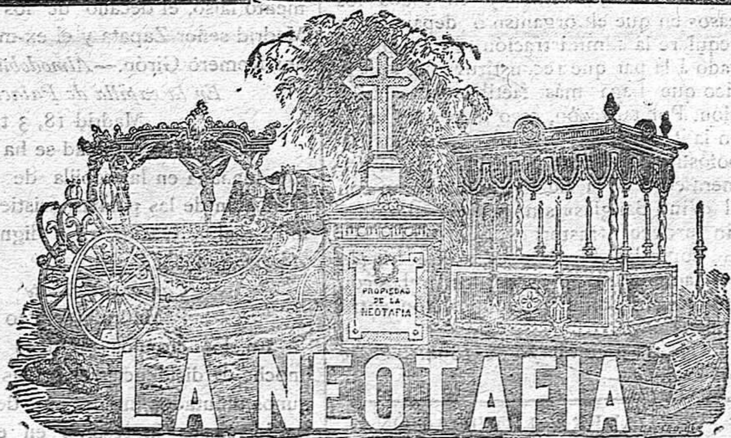
Cort-Real número 18.—Gerona

Esta casa que se encarga de todo lo relativo á un entierro recomienda que en el caso de una defunción no se dejan sorprender por personas que movidas por cierto interés particular aconsejan tal ó cual otra casa sin acudir directamente á La Neotafía que tiene acreditados sus económicos servicios.