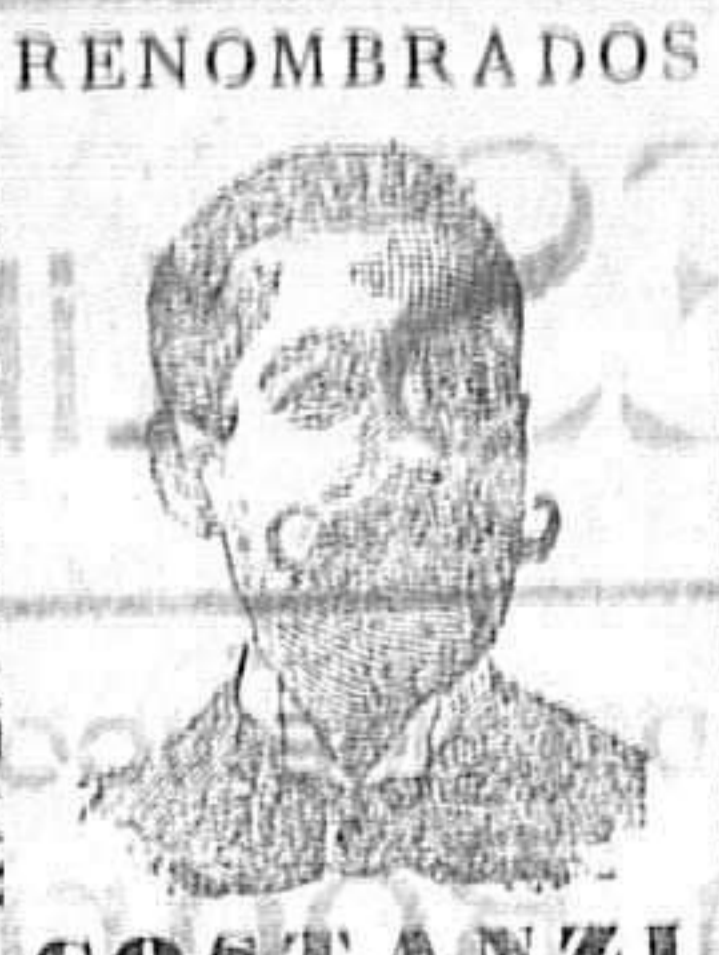
INVENTOR DE LOS