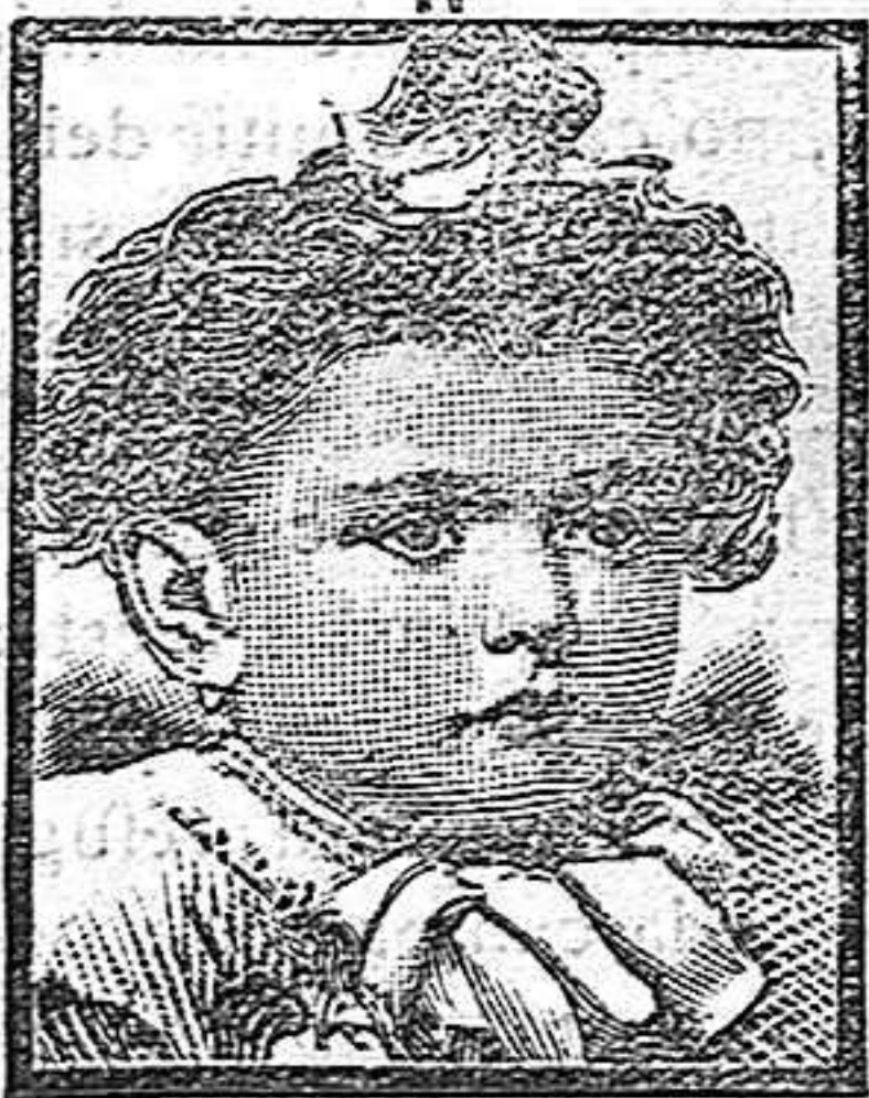
Barcelona, 22 Abril 1908.

Los habitantes de Porté (Pirineos Orientales) están bloqueados por las nieves, que alcanzan tres metros de altura. En el pueblo las gentes se ven obligadas á salir por las ventanas. Ha habido dos fallecimientos, y se está aguardando que abandone el tiempo para poder enterrarlos.