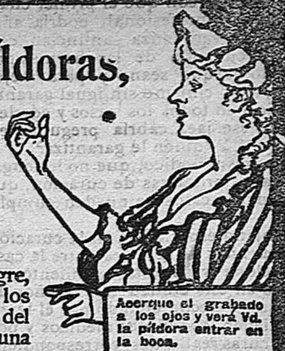
Acerque el grabado a los ojos y verá Vd. la píldora entrar en la boca.

DE VENTA EN LAS BOTICAS DEL MUNDO ENTERO.