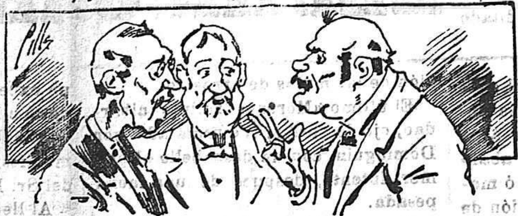
Abominan á nuestros libros..... pero los compran.

Todas las personas de gusto, curiosas é ilustradas deben pedir al Director de LA AVISPA, apartado núm. 8, MADRID, un ejemplar que se remite gratis y franqueado. Esta Revista Enciclopédica Popular publica recreaciones científicas, recetas de cocina, repostería, confitería, vinos, licores, pinturas, barnices, betunes y fórmulas para toda clase de industria, y cuantas noticias y conocimientos puedan ser beneficiosos. Cuenta además con buenos grabados, parte literaria excelente; da regalos mensuales á sus lectores con la Lotería Nacional y participaciones en la misma, á cuyo efecto compra todos los sorteos, y en una de las Administraciones más afortunadas por la suerte, billetes enteros. La suscripción y los números que se nos pidan se sirven gratuitamente á correo vuelto y franqueados, con sólo indicar el nombre y dirección del que lo desea en sobre dirigido al Sr. Administrador de