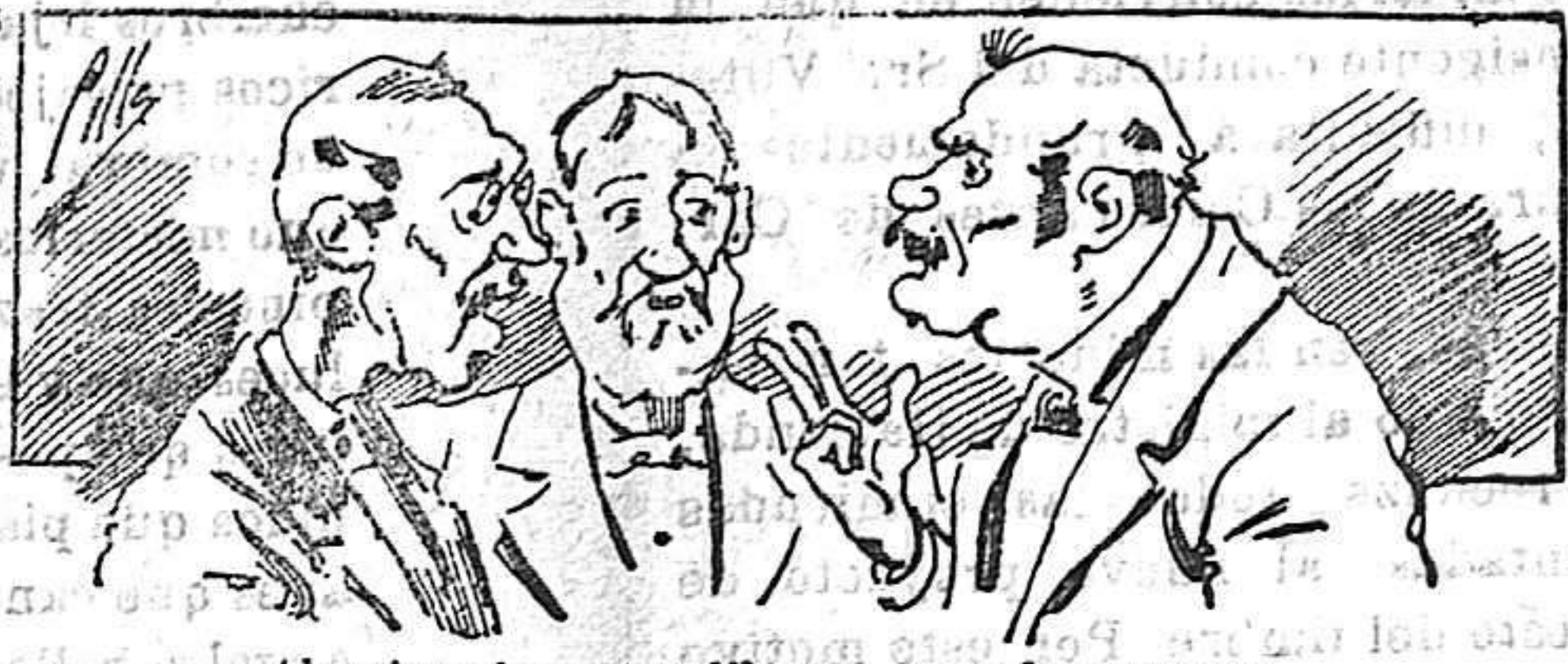
Abominan á nuestros libros....., pero los compran.

Todas las personas de gusto, curiosas é ilustradas deben pedir al Director de LA AVISPA , apartado núm. 8, MADRID, un ejemplar que se remite gratis y franqueado. Esta Revista Enciclopédica Popular publica recreaciones científicas, recetas de cocina, repostería, confitería, vinos, licores, pinturas, barnices, betunes y fórmulas para toda clase de industria, y cuantas noticias y conocimientos puedan ser beneficiosos. Cuenta además con buenos grabados, parte literaria excelente; da regalos mensuales á sus lectores con la Lotería Nacional y participaciones en la misma, á cuyo efecto compra todos los sorteos, y en una de las Administraciones más afortunadas por la suerte, billetes enteros. La suscripción y los números que se nos pidan se sirven gratuitamente á correo vuelto y franqueados, con sólo indicar el nombre y dirección del que lo desea en sobre dirigido al Sr. Administrador de