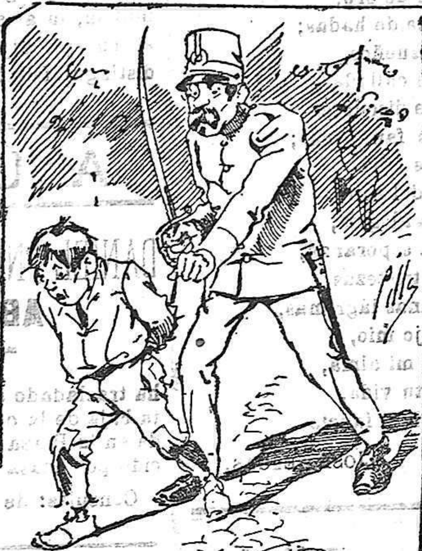
Tratamientos de la policía á nuestros vendedores cuando el número pica...