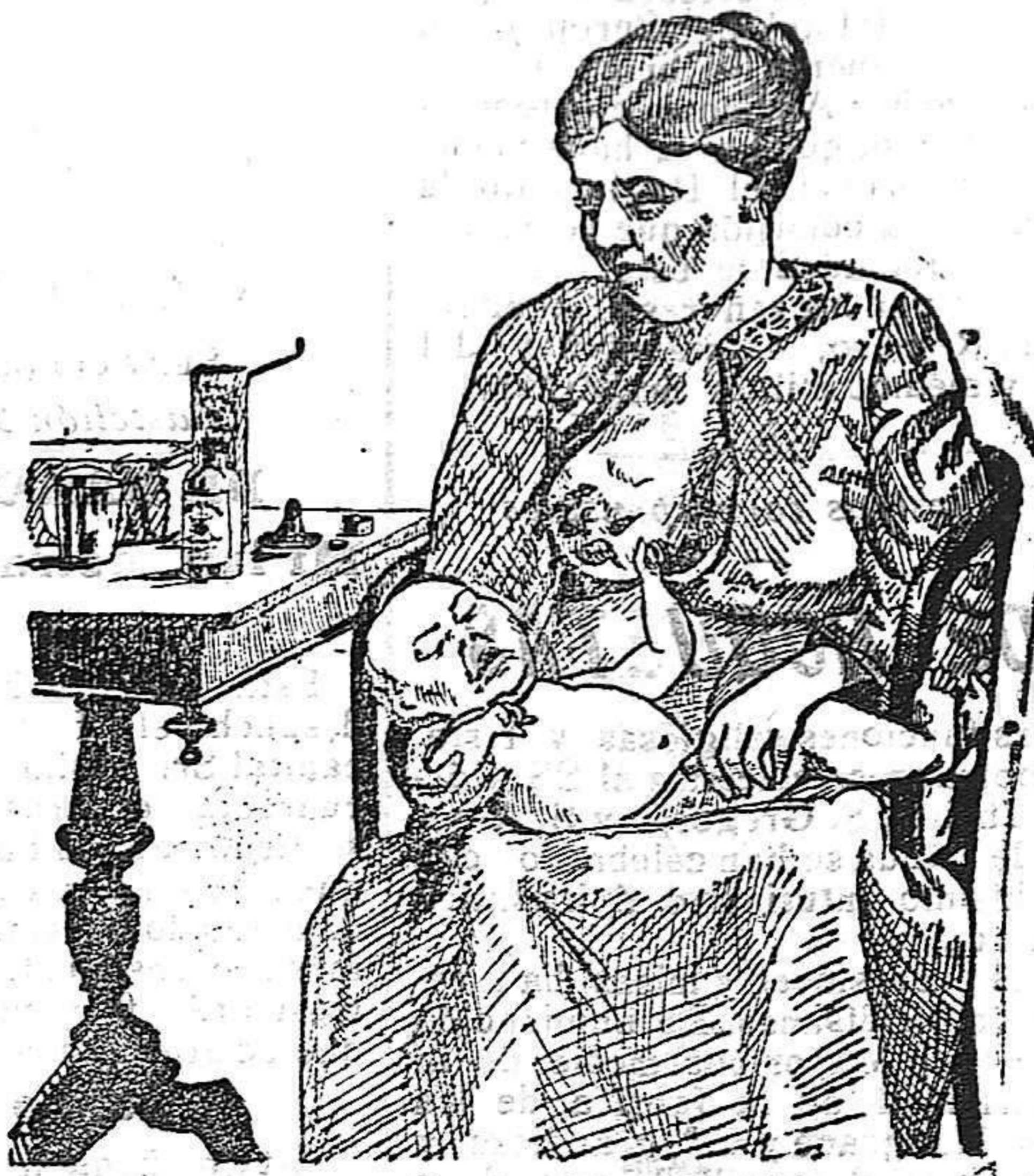
La que no hizo caso del Salverol