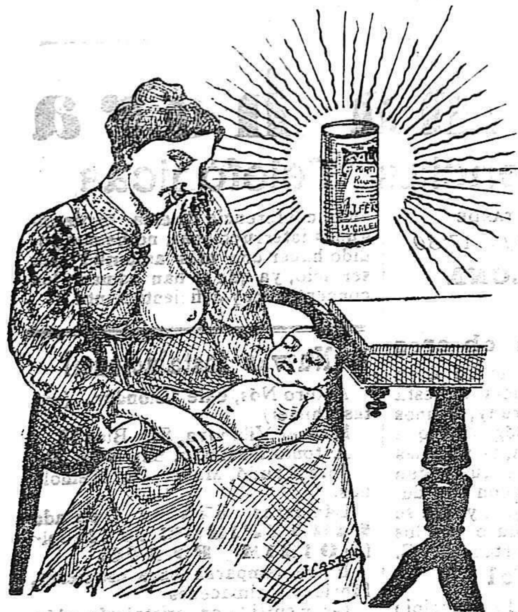
La que hizo caso del Salverol

Depósito general S. A. del Salverol en Santa Bárbara (Tarragona)