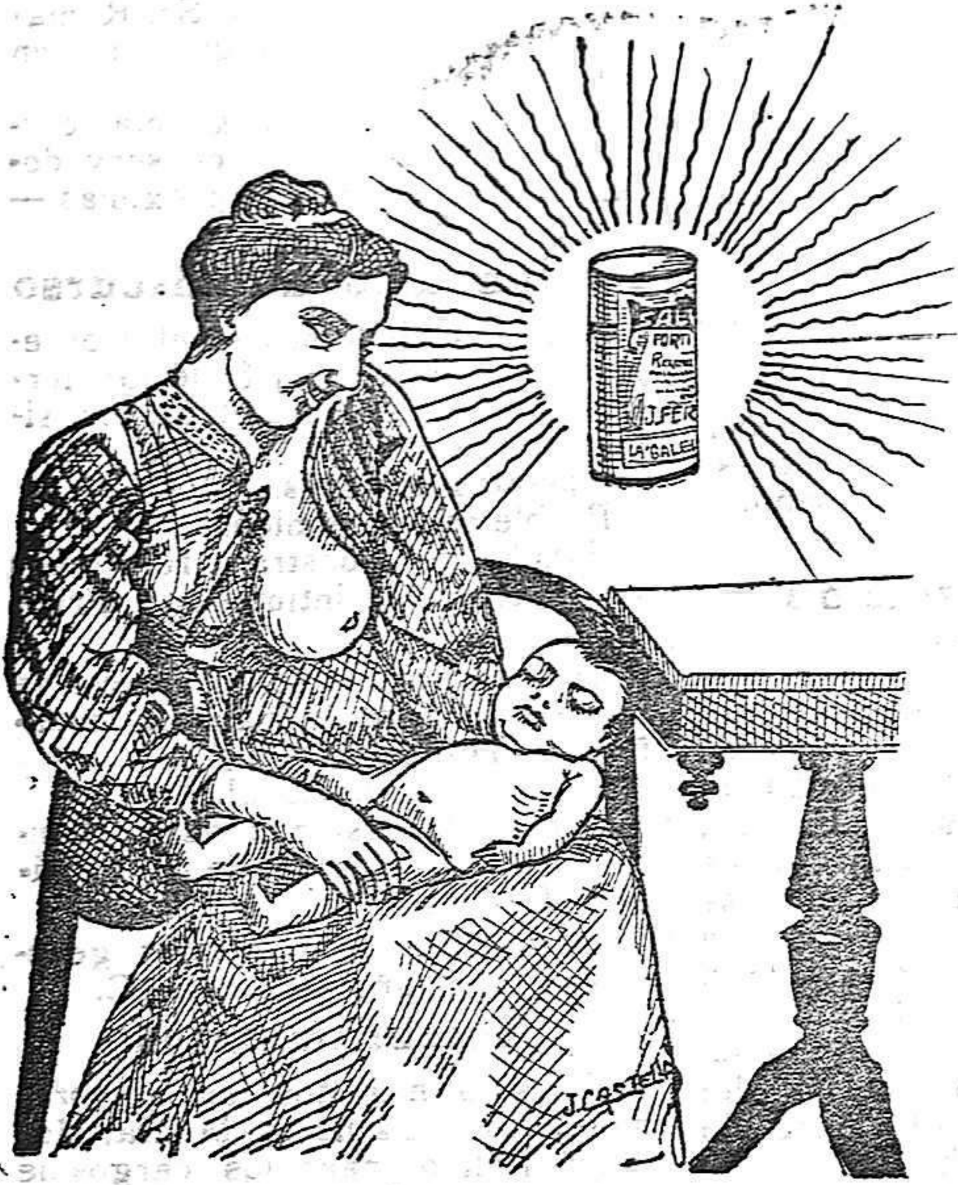
La que hizo caso del Salverol

Depósito general S. A. del Salverol en Santa Bárbara (Tarragona)