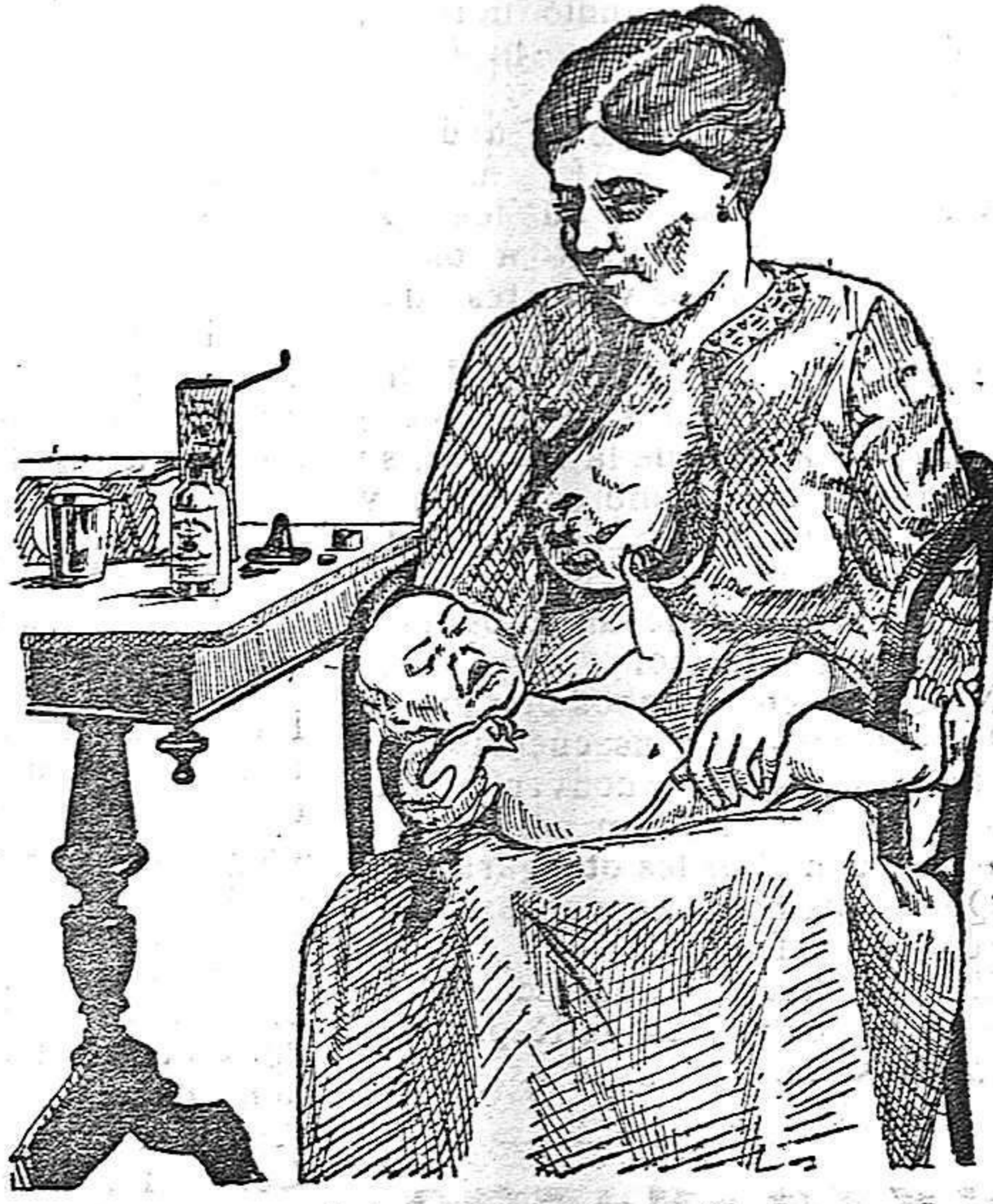
La que no hizo caso del Salverol