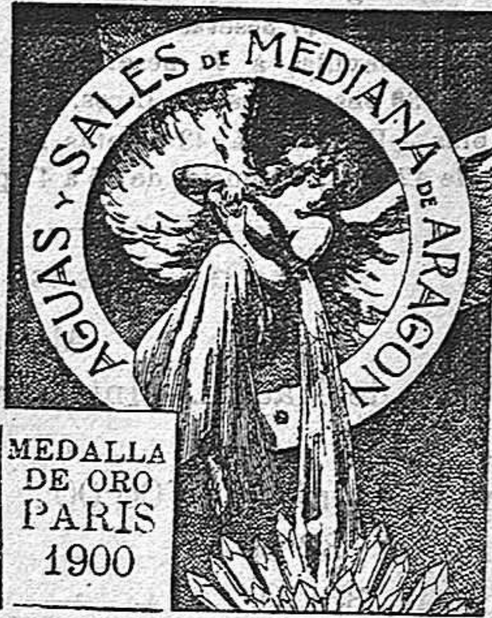
MEDALLA DE ORO PARIS 1900

Tomadas en Loción y Baño son eficacísimas y superiores á todo tratamiento para combatir el He. peismo, h. ser fulismo, Eczemas y todas las afecciones de la piel que tienen por origen la impureza de la sangre.