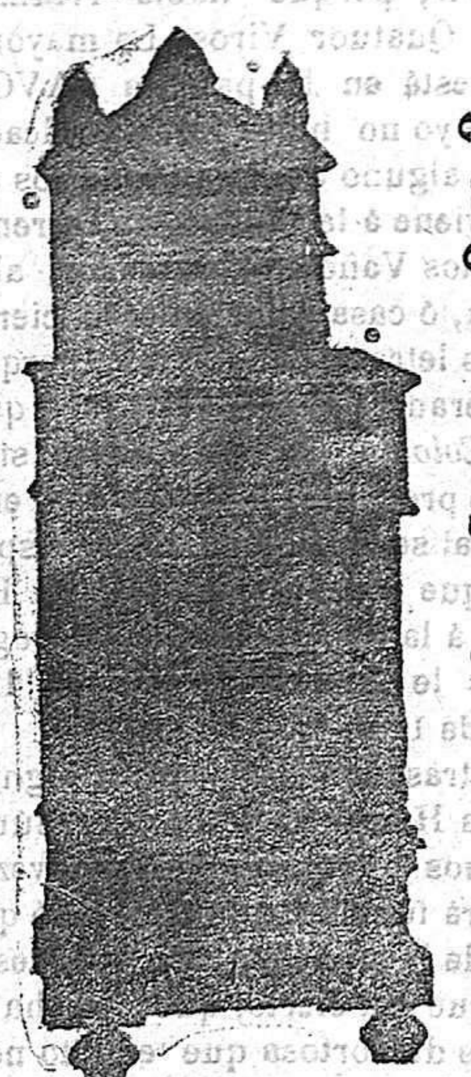
Moncada, 6 y Carmen, 2 y 3

Taller de ebanistería Carpintería y Depósito de muebles de todas clases Manuel Panisello Unica casa para el arreglo de sillas. Fonógrafos ODEÓN de una sonoridad y armonía perfectas, desde 50 a 400 pesetas, a plazos y al contado. Discos de dos caras. SOLIDEZ, ELEGANCIA, ECONOMIA Moncada, 16 y Carmen, 2 y 3 TORTOSA