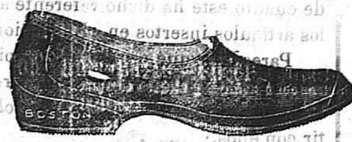
Caballero, 8 pesetas.