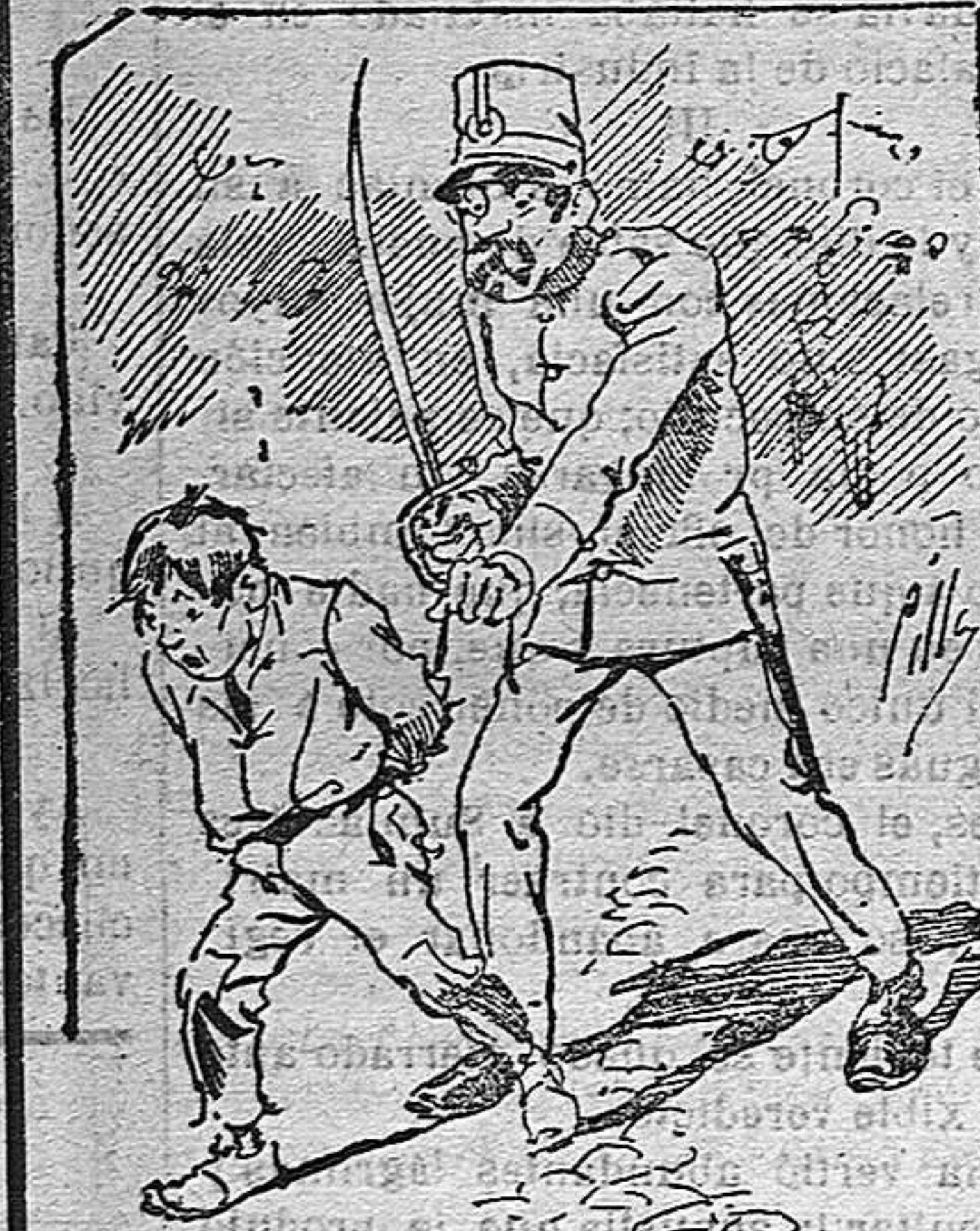
Tratamientos de la policía á nuestros vendedores cuando el número pica...

También puede pedirse LA AVISPA y el CATALOGO RESERVADO en casa de nuestros corresponsales autorizados, si no se quiere escribir á la Administración