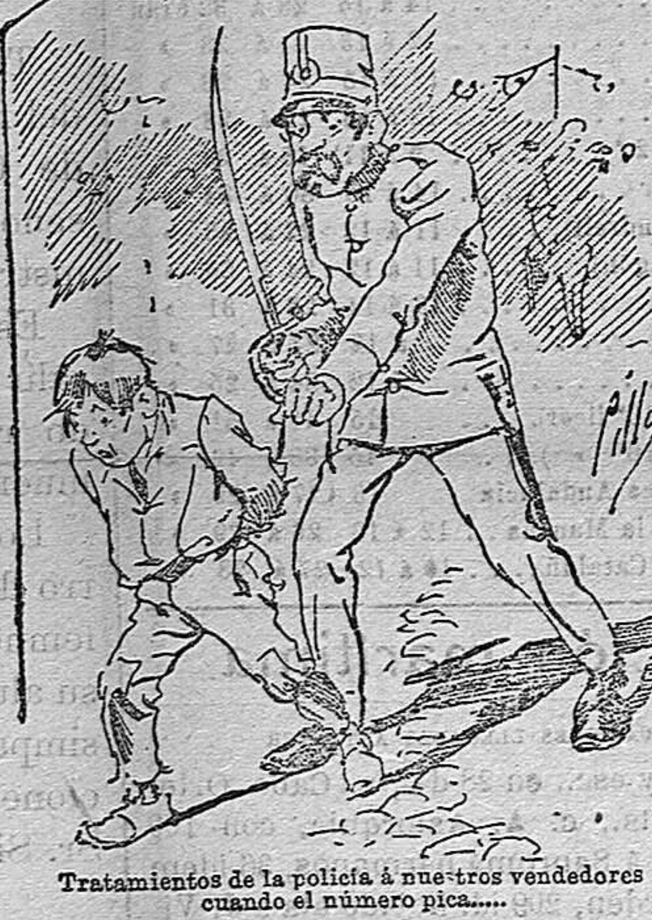
Tratamientos de la policía a nuestros vendedores cuando el número pica.....

Abominan a nuestros libros....., pero los compran. Con sólo indicar el nombre y dirección del que lo desea en sobre dirigido al Sr. Administrador de